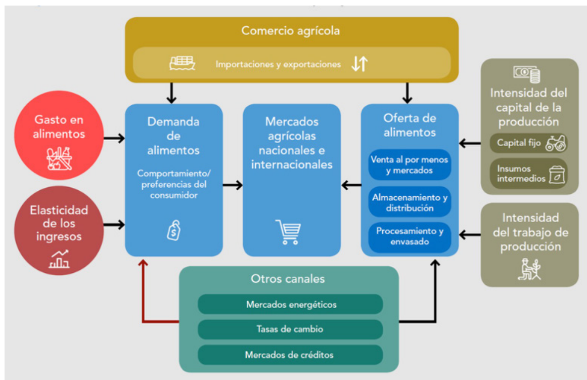
Figura 2. Principales canales de transmisión de los efectos del COVID-19 a la alimentación y la agricultura