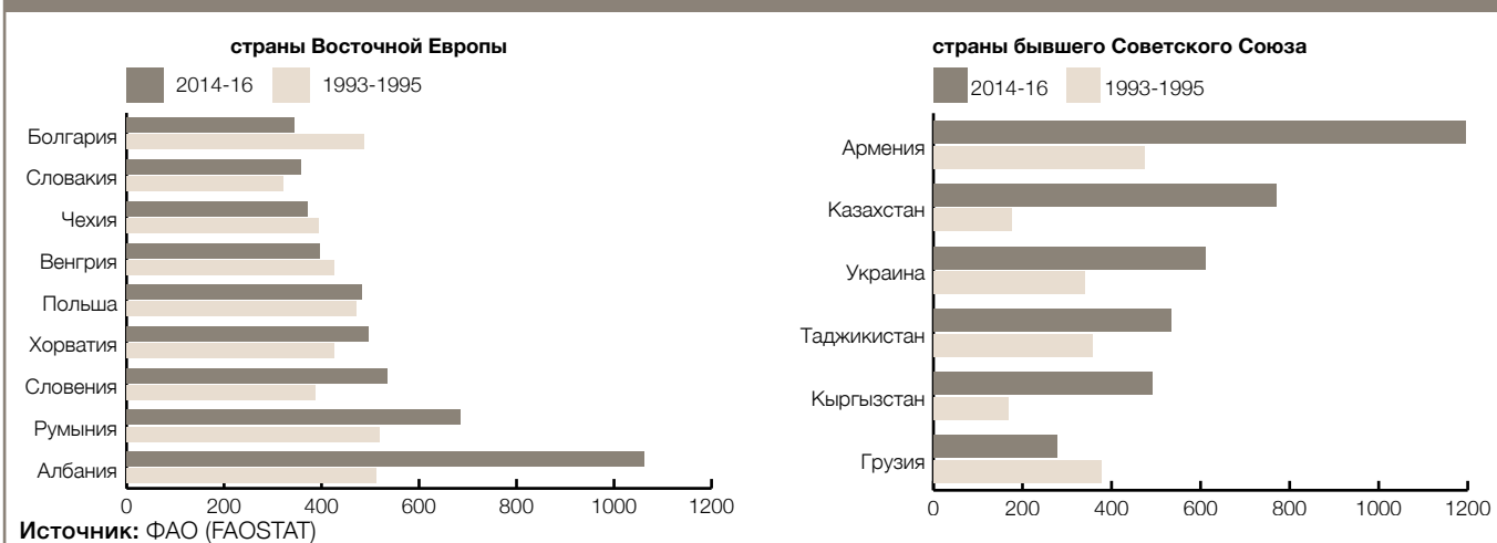
Рисунок 3. Наличие фруктов и овощей для продовольственных нужд, в 1993–1995 и 2014–2016 гг., г/чел/день