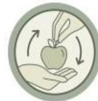
Economía circular y solidaria