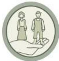
Valores humanos y sociales