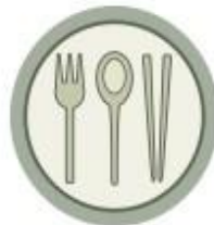
Cultura y tradiciones