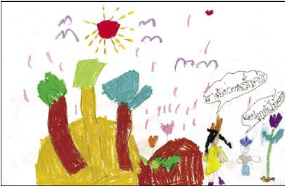
Napassorn Archavaniyut 5 años Bangkok, Tailandia

(Izquierda) Tenemos que ayudar a cuidar el bosque. (Derecha) Ayudamos a plantar muchos árboles.