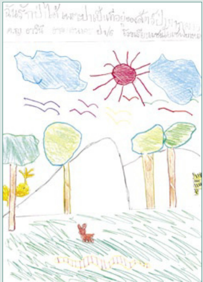
Tawinee Tumtanakorn 6 años Bangkok, Tailandia