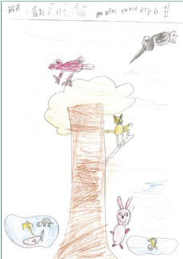
Me gusta el bosque