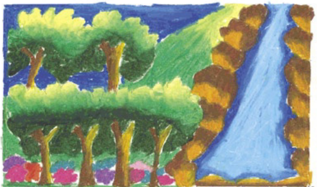
Aya Chotecheewin 11 años Bangkok, Tailandia

El bosque rico. Si lo cuidamos Ven, ven. Plantemos algunos árboles.