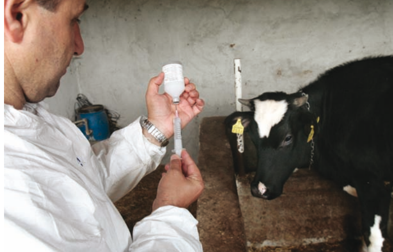
Arriba: Preparándose para vacunar el ganado en Turquía.