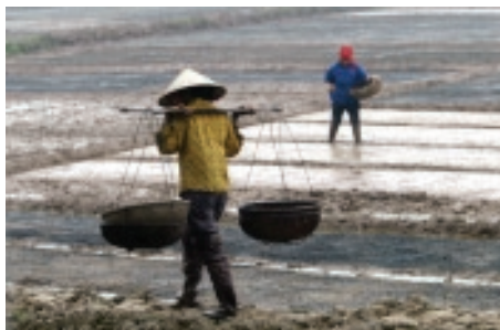
Au travail dans les rizières.