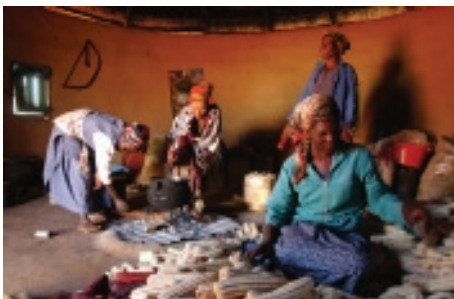
Tri des semences de maïs.

de routine conduites par les femmes, comme le brûlage des déchets horticoles. Le projet a formé des villageois pour les aider à mettre au point des techniques améliorées d'aménagement des bassins versants et d'utilisation des terres, telles que la récolte de l'eau et la création et l'entretien de coupe-feu. Les villageois ont également appris à produire des engrais biologiques pour reconstituer les réserves du sol en fabriquant du compost avec des petites branches, des brindilles et des plantes et fibres biodégradables. Le projet a également formé des villageois à la collecte, au stockage et à la commercialisation de produits forestiers non ligneux, comme les champignons et les plantes aromatiques.