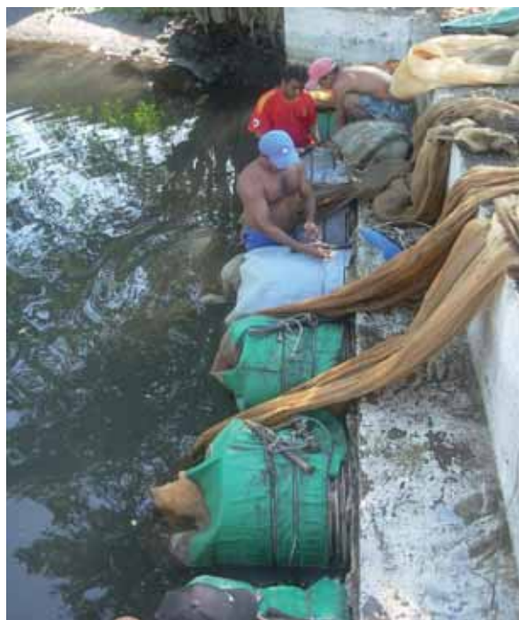
Los filtros en la toma de agua son actualmente comunes en las granjas de camarón.

Las aguas residuales de las instalaciones de cuarentena se deben liberar hacia un tanque especial de sedimentación de concreto o con cubierta protectora. Del tanque de sedimentación, se debe pasar a un tanque de tratamiento en donde se debe clorar (< de 20 ppm de cloro activo por > de 60 minutos o por 50 ppm por < de 30 min.) y entonces eliminar el