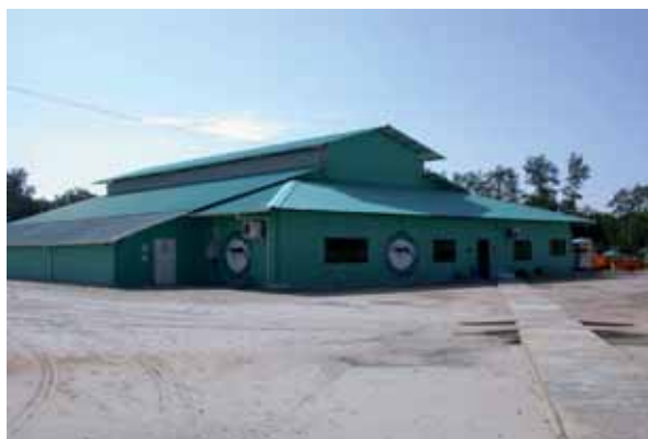
Unidad de producción larvaria de L. vannamei biosegura cerrada y bajo techo.

Las secciones individuales del área de cuarentena se deben designar como