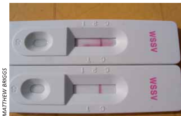
Si una enfermedad exótica seria es diagnosticada durante la cuarentena oficial, el operador debe notificarlo inmediatamente.

Se debe mantener el registro de actas (electrónico o manual) y los documentos originales asociados (recibos de embarques, certificados de salud, autorización de bioseguridad, etc.) para todos los embarques de animales acuáticos que entran a las instalaciones de cuarentena.