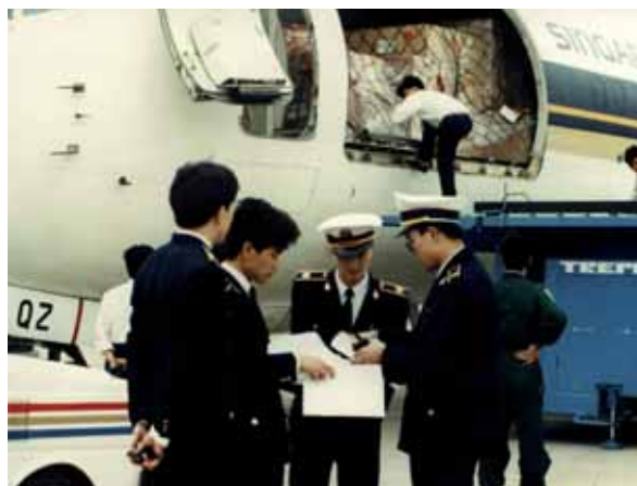
La inspección de los envíos por la Autoridad Competente es una parte crucial del proceso de cuarentena.

Introducción – movimiento de un animal acuático asistido por un humano a un área fuera de su área natural.