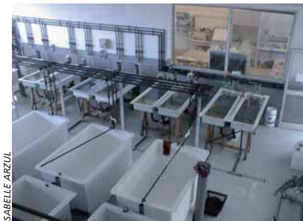
Se observa una Instalación de Cuarentena diseñada para moluscos con equipo especial de bandejas o tanques someros.

nacional de bioseguridad, como parte del proceso de análisis de riesgos. De esa manera, se han realizado pocos intentos para identificar y priorizar los riesgos y buscar los caminos para reducirlos efectivamente basándose en un arsenal completo de medidas de la gestión de los riesgos que están disponibles (Capítulo 1.6.).