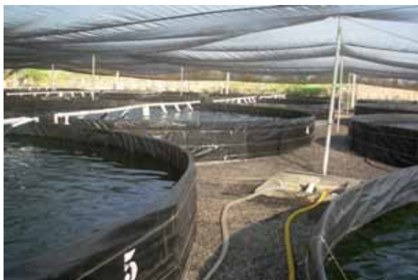
Instalación de maduración de reproductores de Litopenaeus vannamei biosegura.