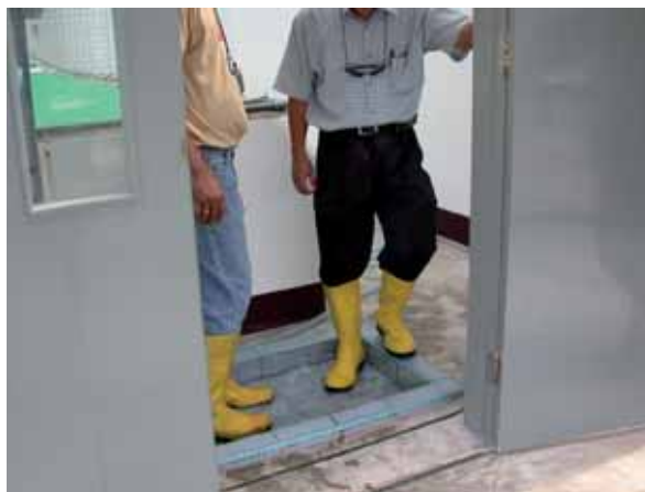
En la puerta de entrada a las instalaciones se debe colocar un tapete o baño sanitario para los pies que contenga desinfectantes.