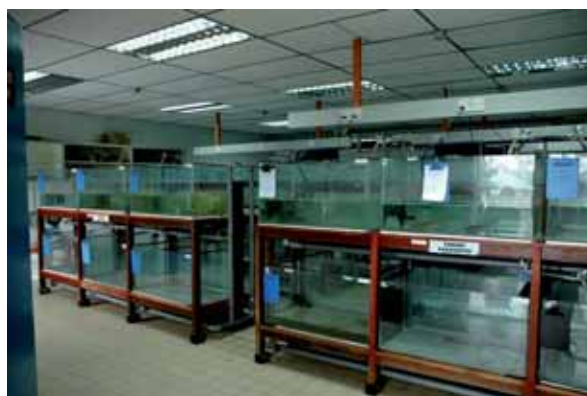
Se deben mantener las hojas de registro para cada taque de cuarentena.

El operador, debe desarrollar un plan de contingencia dirigido a tomar acciones en el evento de que un vehículo se descomponga durante el transporte de los animales acuáticos de la frontera de llegada hacia las instalaciones de cuarentena o debido a emergencias en el sitio que se puedan presentar, tales como fuego, inundaciones, falla eléctrica o descompostura de equipo esencial (aireadores, bombas etc.). En caso de emergencia se debe notificar tan pronto como sea posible al supervisor Oficial de Cuarentena.