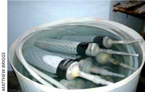
La desinfección del equipo antes y después de su uso en la cuarentena es un requisito.

contenga yodo al 0.5% de yodo disponible durante 5 minutos o (iii) por algún otro procedimiento de desinfección aprobado por el supervisor Oficial de Cuarentena.