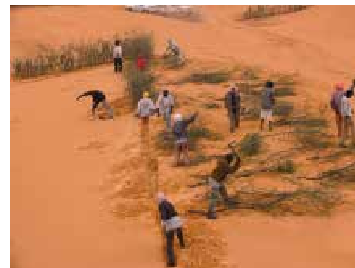
Première étape: construire des brise-vent

Un projet de la FAO en Mauritanie devient un cas d'école pour la lutte contre la désertification en Afrique