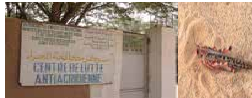
La lutte antiacridienne Ravages du criquet sur les productions agricoles