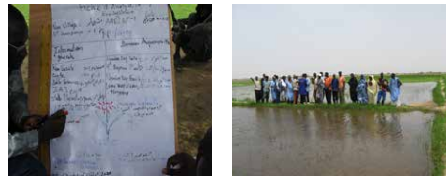
Photos : Sessions de formation des agriculteurs

Les principales activités développées sont :