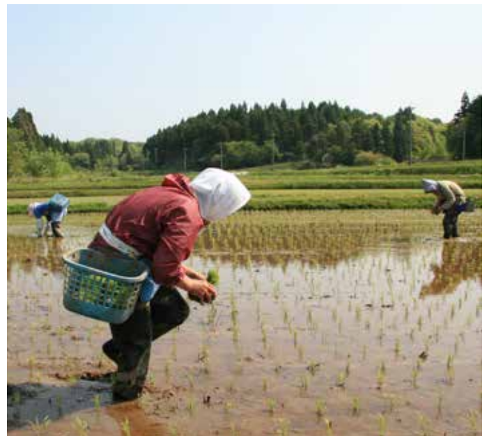
Aménagement durable des paysages à Satoyama-Satoumi au Japon pour renforcer la capacité d'adaptation au changement climatique.

de conservation des sols devraient permettre de réduire les émissions de gaz à effet de serre provenant de l'agriculture, d'améliorer la séquestration du carbone et de renforcer la résilience au changement climatique.