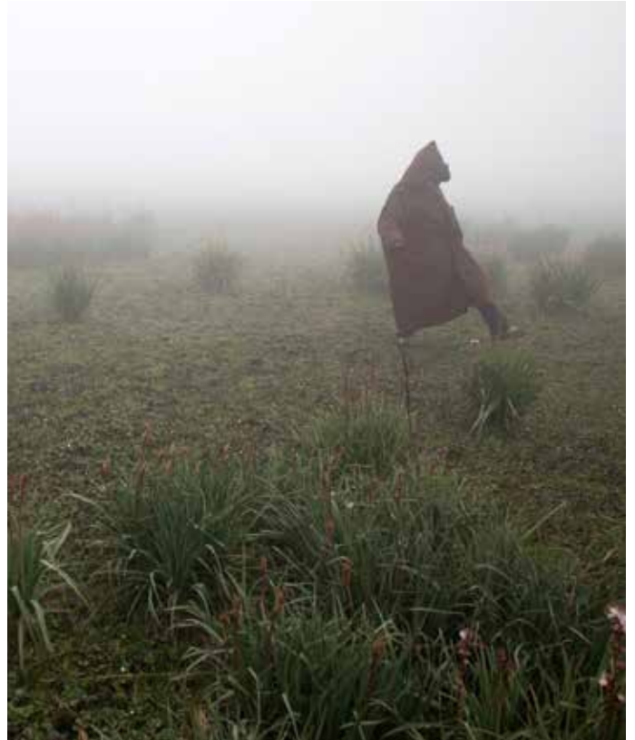
Un villageois en train de marcher dans une tourbière en Tunisie.