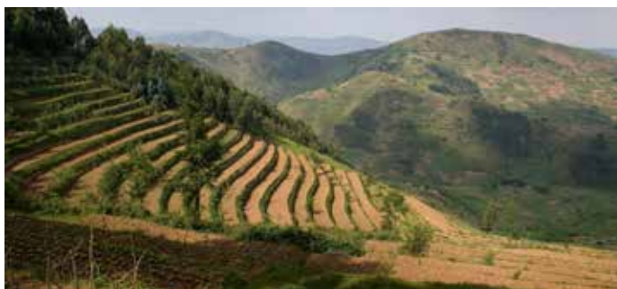
Les collines en terrasses aident les sols à retenir l'eau et à prévenir l'érosion.