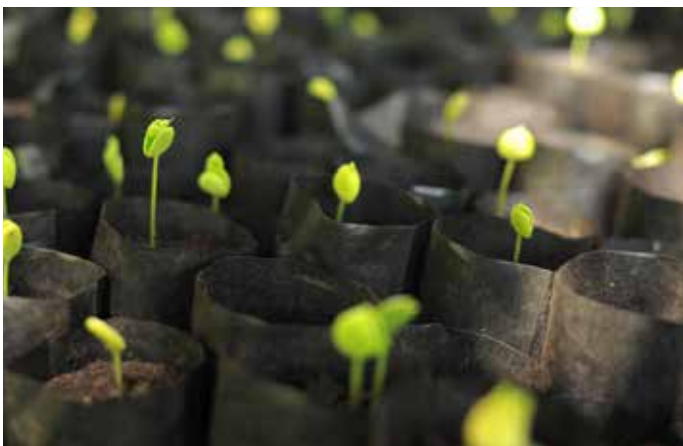
Des semis de moringa dans une pépinière. L'arbre de moringa joue un rôle très important pour atténuer le changement climatique et augmenter les revenus des paysans pauvres en Afrique.