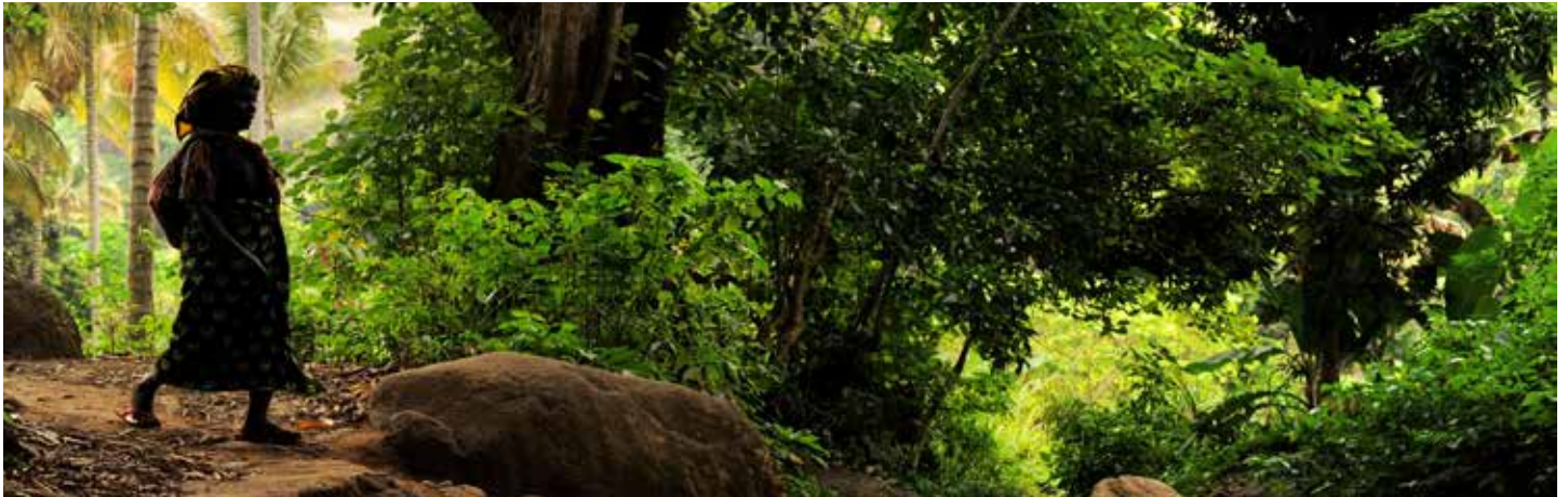
Une femme traverse un des nombreux cours d'eau relié à un canal d'irrigation utilisé pour une agriculture intelligente face aux changements climatiques en Tanzanie.

Organisation des Nations Unies pour l'alimentation et l'agriculture