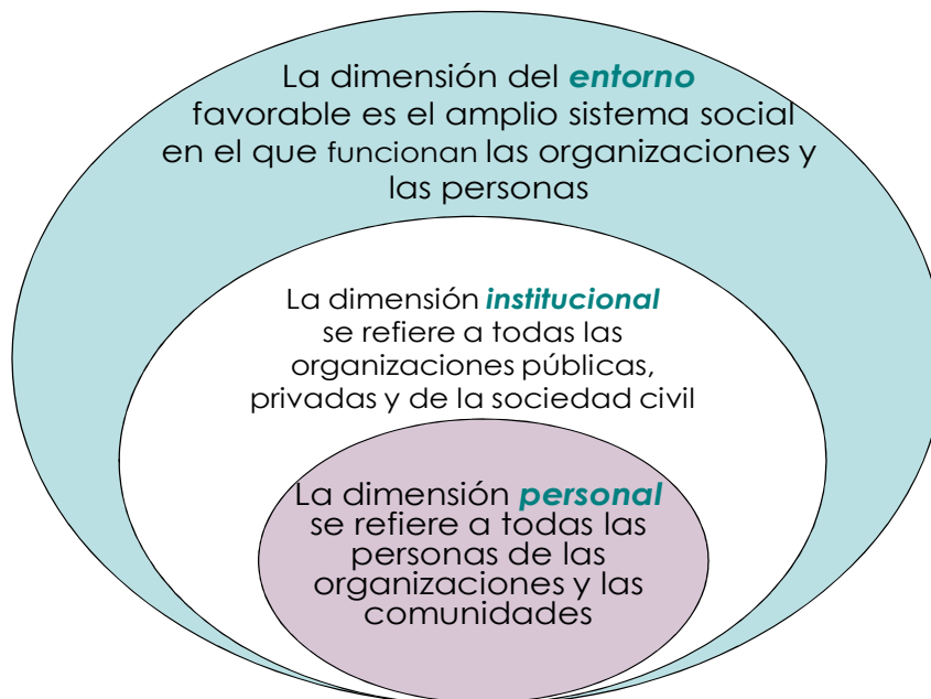
Figura 2: Las tres dimensiones del desarrollo de capacidades

13. En las intervenciones sobre el DC las tres dimensiones están relacionadas entre sí: las personas, las organizaciones y el entorno favorable forman partes de un conjunto más amplio. A menudo el DC comprende el perfeccionamiento de los conocimientos de las personas, si bien su rendimiento depende en gran medida de la calidad de las organizaciones en que trabajan. Además, la eficacia de las organizaciones y de las redes de organizaciones depende del entorno favorable 11 . Mientras que la eficacia del entorno depende de las organizaciones y las relaciones entre ellas.