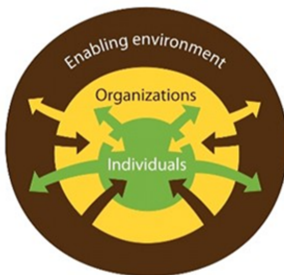
Figura 1: Marco de desarrollo de capacidades de la FAO

10. Las capacidades técnicas se requieren en las amplias áreas de la alimentación y la agricultura para que los participantes nacionales regionales y subregionales puedan llevar a cabo todas las tareas técnicas necesarias con el fin de intensificar la producción de manera sostenible, administrar los recursos naturales y, en consecuencia, mejorar la inocuidad de los alimentos y la seguridad de todos. La labor técnica de la FAO está especificada en los once objetivos estratégicos (A-L) del Marco estratégico.