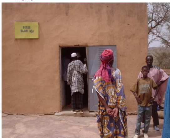
Banque communautaire de Pètaka /Douentza