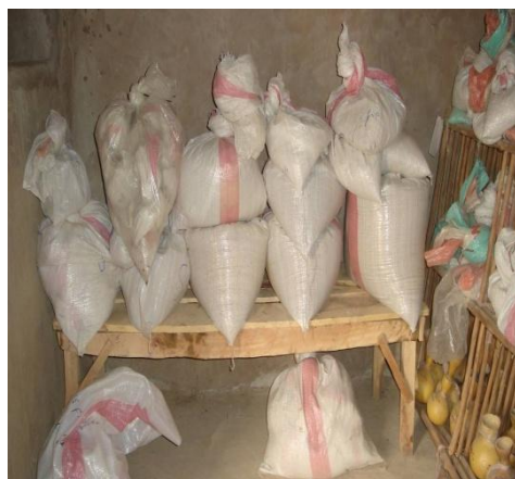
Intérieur banque communautaire Fodokan