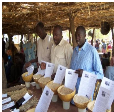
Elus de l'AOPP présentant les variétés améliorées de l'IER à la Foire de Kaniko 2005