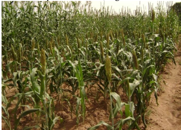
Parcelle de champs de diversité (CD) Boumboro 2009