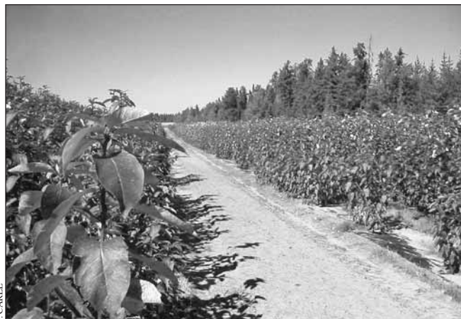
Pépinière de clones de peupliers au Québec: le modèle d'évaluation des risques indique qu'avec un matériel végétal approprié, des clones adaptés au site et un aménagement rationnel, la plantation de cultivars de peupliers est envisageable au Canada