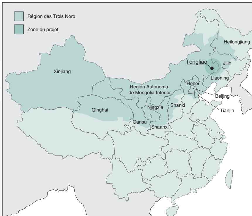
Zone du projet dans les terres sablonneuses de Korqin

ploi d'arbustes pour former des enclos et des haies autour et au sein des pâturages, et l'utilisation des rideaux-abris pour réduire l'érosion éolienne et organiser le pâturage tournant contrôlé. Le projet a également testé la mise en place de clôtures pour éloigner les animaux divagants pendant les périodes critiques de l'établissement, ainsi que le labour limité et le maintien dans le champ du chaume des cultures (du maïs, en particulier) pour réduire l'érosion éolienne et améliorer la fertilité des sols. Les bergers et agriculteurs locaux ont été consultés et ont participé à la conception, la planification, la préparation et la réalisation des modèles agroforestiers. L'érosion éolienne dans les zones pilotes a ainsi été réduite de 75 pour cent par rapport aux terres avoisinantes (State Forestry Administration of China, Belgium Development Cooperation et FAO, 2002).