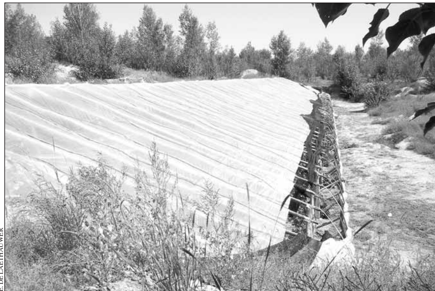
Des peupliers protègent des serres établies sur le côté sous le vent des dunes de sable pour la production de raisin

A l'aide de cartes de classification des sols et du site, de nouveaux modèles de boisement ont été élaborés sur la base des résultats des essais et des démonstrations, y compris une série de mécanismes comprenant des forêts, des arbres et des arbustes, ainsi que des systèmes agroforestiers. Des analyses financières ont été réalisées pour chaque modèle de boisement et de reverdissement, en vue de tester la viabilité et la sensibilité des taux de rentabilité interne vis-à-vis de la productivité des nouvelles normes de travail, des coûts et des prix. Les modèles techniques et financiers, qui reflétaient les démonstrations les plus réussies effectuées sur le terrain, se sont avérés des outils précieux de planification et de prise de décisions (FAO, 2004).