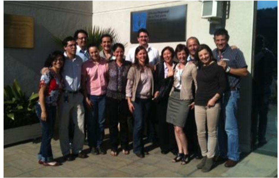
Equipo de trabajo en la Oficina Regional de FAO para la Iniciativa América Latina y Caribe Sin Hambre.

2 funcionarios de AECID Madrid y 9 OTCs participaron directamente de la evaluación