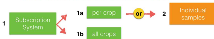
Fig. 1 Elements of a subscription system, with or without an alternative access to individual samples