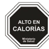
Imagen de los indicadores de altos niveles de azúcar, grasas, sal y calorías del Ministerio de Salud de Chile.

Labels issued by the Chilean Ministry of Health indicating high levels of sugar, fat, salt and calories.