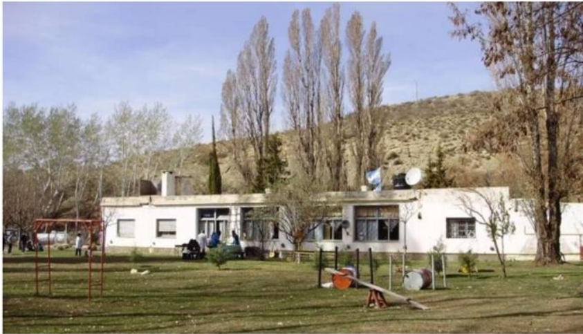
La escuela rural donde asisten los chicos (La Mañana)

Es por la falta de transporte para llevar a los 13 chicos desde los parajes alejados donde viven.