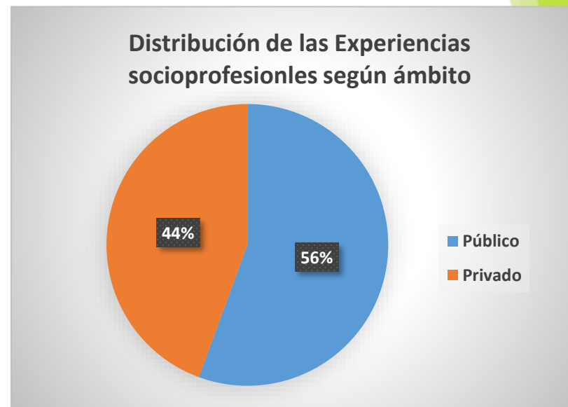
Distribución de Experiencia Socio Profesionales 2017