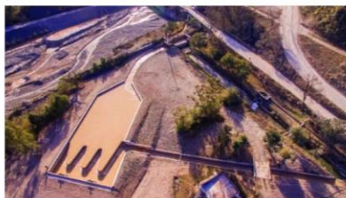
Desareñador en el Río Toro