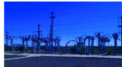
Electrificación Rural – Estación Transformadora Paso Miraflores