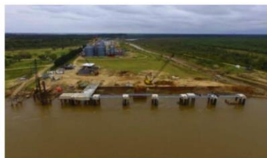
Infraestructura del Puerto Las Palmas