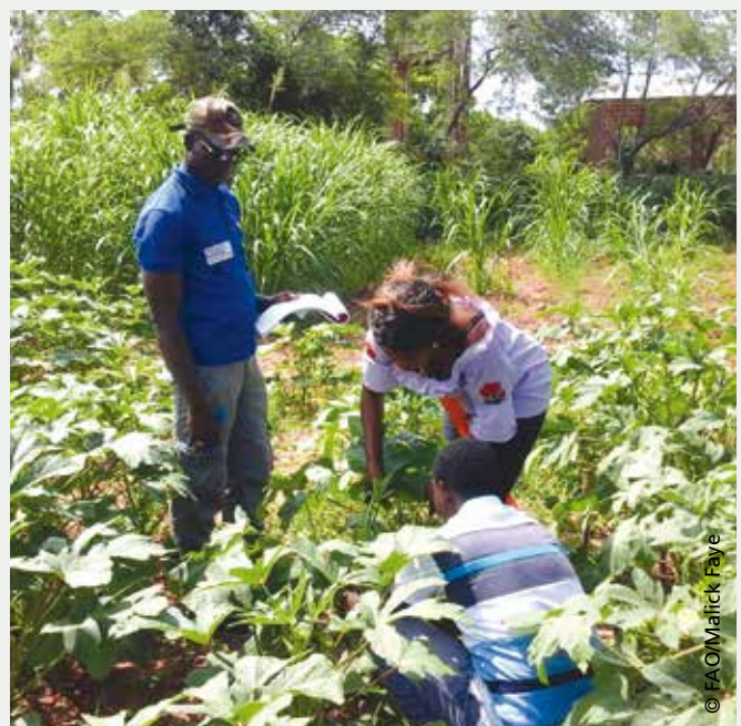
Travaux pratiques sur la parcelle maraichère du CEF à Koungheul

visent à amener les producteurs à maîtriser les bonnes pratiques de production agricole. Un accent particulier est mis sur le choix des espèces et variétés adaptées et les itinéraires techniques appropriés