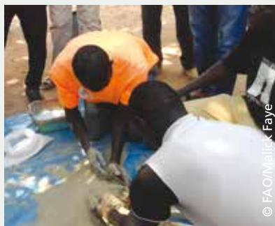
Fabrication de blocs multi nutritionnels au CEF de Kounghoul

Les modules relatifs à la valorisation des produits forestiers non ligneux et à la gestion des énergies de substitution visent à mieux tirer parti des produits de cueillette et réduire la pression sur les ligneux dans le cadre d'une gestion durable des écosystèmes. Un accent particulier est mis sur: