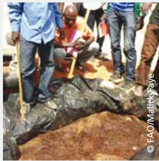
Traitement de la paille à l'urée au CEF de Linguère