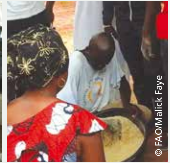
Fabrication d'aliment volaille fait maison au CEF de Koungheul