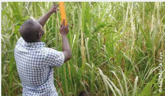
Travaux pratiques sur la parcelle fourragère du CEF à Linguère