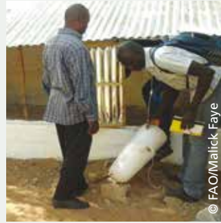
Séance d'AESP au niveau du poulailler du CEF à Linguère