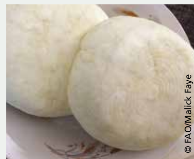
Fabrication de fromage traditionnel amélioré au CEF de Linguère

Les modules portant sur l'amélioration de l'accès aux informations climatiques et météorologiques visent à aider les éleveurs et agropasteurs à mieux organiser la gestion des risques liés aux aléas climatiques.