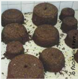
Blocs multi nutritionnels prêts à l'emploi à Vélingara Ferlo