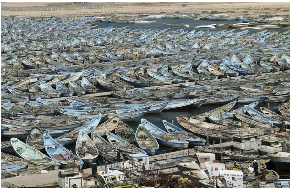
Small scale family fishing boats in the port in Nouadhibou (Mauritania).

Les politiques nationales existantes en matière de pêche et d'aquaculture des États membres de la CEDEAO ne prennent pas suffisamment en compte les effets des problèmes émergents (migration, chômage des jeunes, changements climatiques, croissance démographique et urbanisation rapide) sur la contribution du secteur à la lutte contre l'insécurité alimentaire et nutritionnelle des populations. Des mesures de prévention ou d'adaptation aux effets de ces problèmes émergents sur la sécurité alimentaire et nutritionnelle devraient être envisagées lors de la mise à jour des politiques nationales et de l'élaboration de la future politique régionale des pêches et de l'aquaculture de la CEDEAO.