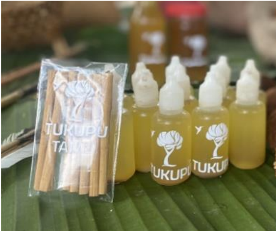
Aceite de Carapa, también conocida como Andiroba

Recolección de semillas e Identificación de brinzales