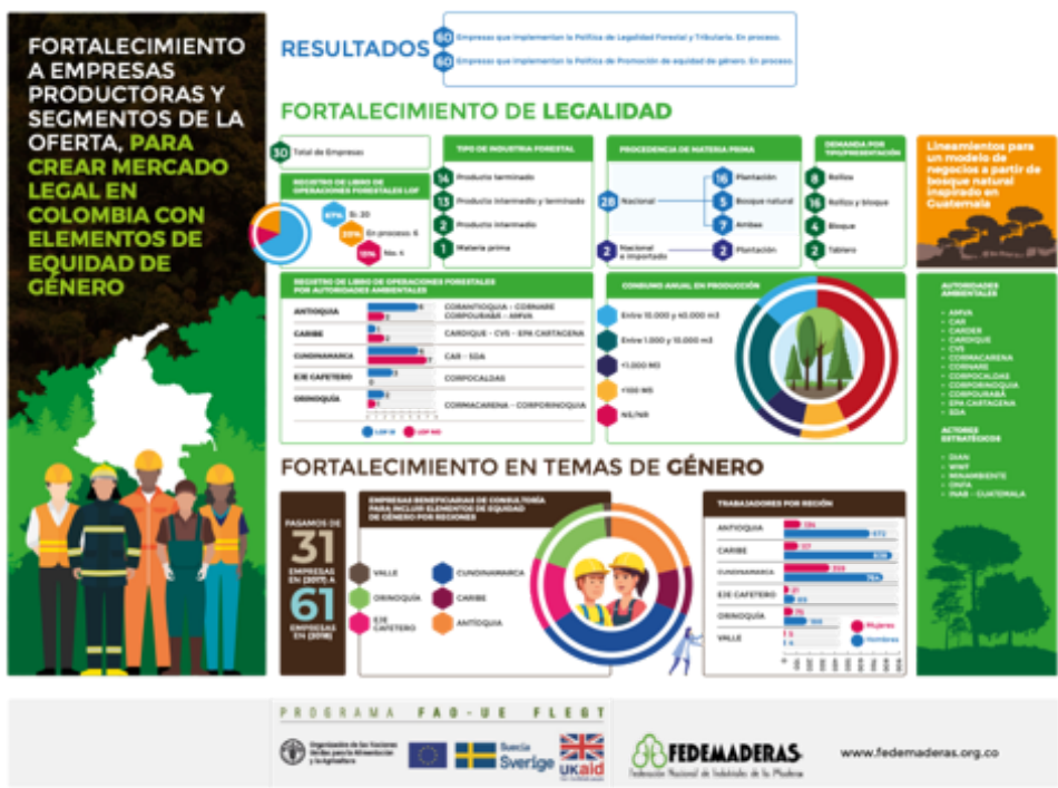
Figura 1: Infografía con resultados del proyecto implementado por FEDEMADERAS

En la categoría de nivel organizacional se resalta el estudio de medios de vida realizado por FDSF en Honduras, el cual tuvo una primera etapa elaborada en 2015 y una etapa de seguimiento en 2019 (Figura.2). Se cita a continuación textualmente lo dicho en el taller por una de las participantes, integrante del movimiento ambientalista APA Liberación, quien expuso los principales puntos tratados frente a las perspectivas de las mujeres en el proceso del AVA- FLEGT (FDSF 2019a, 6p):