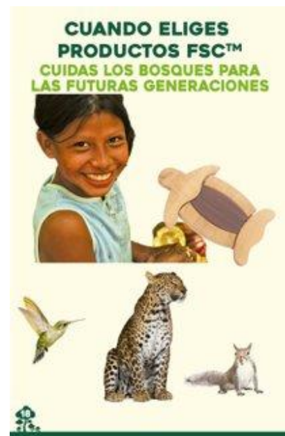
Figura 4: Mujer en labor de la cadena forestal y Diagramación con inclusión de mujeres, niños y jóvenes.