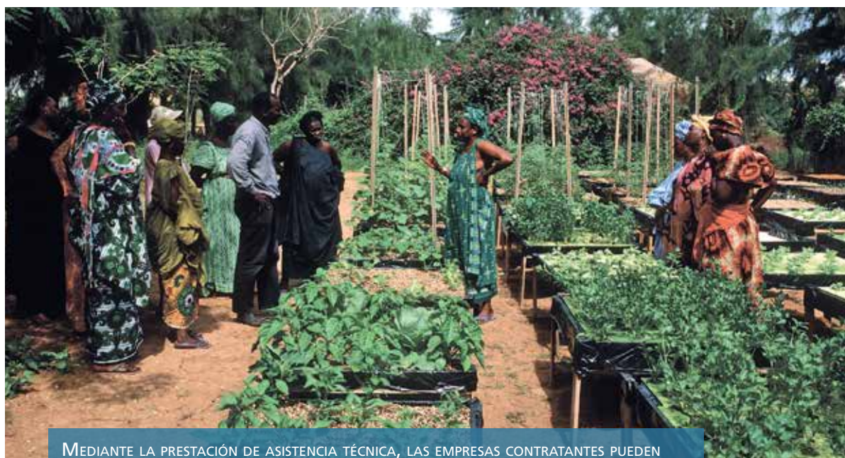
MEDIANTE LA PRESTACIÓN DE ASISTENCIA TÉCNICA, LAS EMPRESAS CONTRATANTES PUEDEN PROMOVER MEJORAS EN LA PRODUCTIVIDAD AGRÍCOLA Y LOS INGRESOS DE LOS AGRICULTORES.

unos a los otros. La confianza y el respeto mutuos son factores importantes para el éxito de las operaciones de la agricultura por contrato.