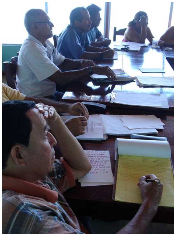
Négociations en cours pour un pacte social territorial. Sud du Costa Rica, 2009.

Enfin, le processus est censé aboutir à un nouveau cycle de négociations qui permettra aux acteurs concernés d'affiner, d'adapter et de compléter l'accord qu'ils ont atteint dans un premier temps. Par conséquent, le dialogue entre les acteurs devrait être institutionnalisé pour faciliter la reproduction du processus de développement territorial négocié et pour assurer sa durabilité.