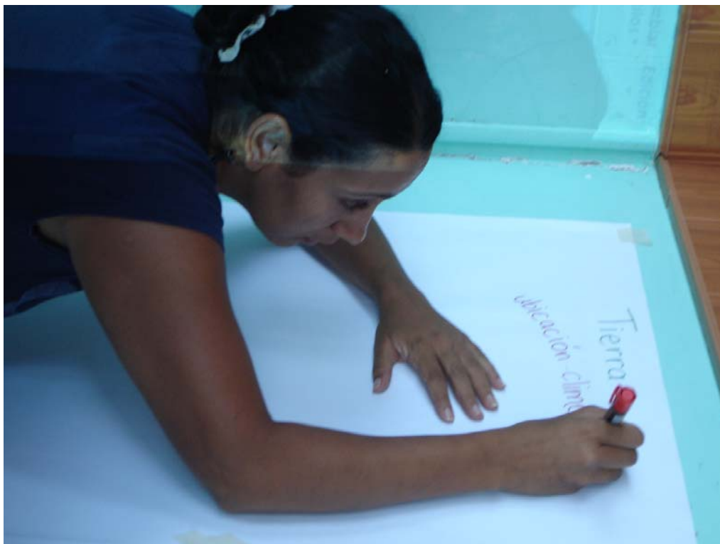
Un facilitateur lors du report des indications fournies par les divers participants. Sud du Costa Rica, mars 2009.