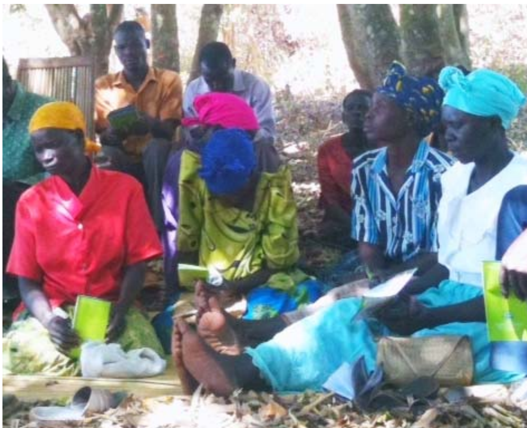
Session de concertation entre membres de la communauté rurale de Gulu, région d'Acholi (Ouganda), février 2012.

Pareille mobilisation du capital social implique des conditions de travail équitables et avant tout la reconnaissance du rôle déterminant des femmes dans l'agriculture et le développement local (Bruinsma, 2010).