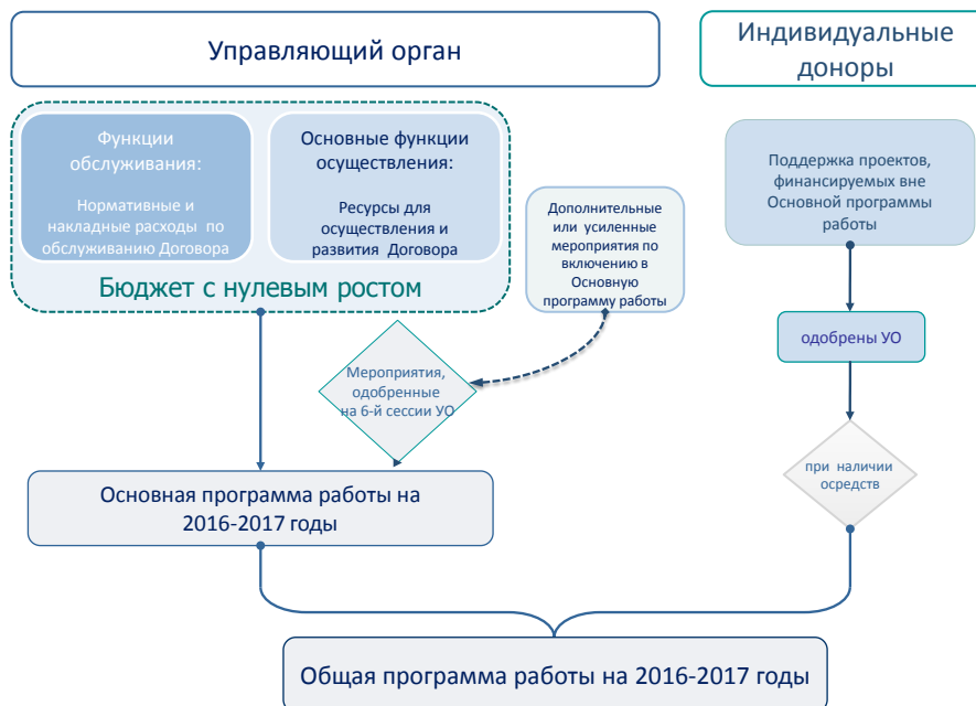
Рис. 2: Консолидация Основной программы работы и Основного административного бюджета