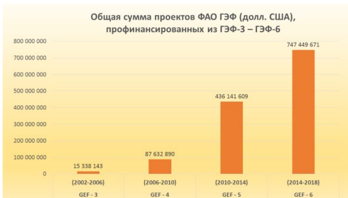
Таблица 2. ФАО и Глобальный экологический фонд (ГЭФ)

7. ФАО стремительно наращивает масштабы своей деятельности и программ. В целях обеспечения более эффективного оперативного руководства и результативного и своевременного решения поставленных задач ФАО необходимо дополнительно скорректировать организационную структуру, расширив возможности подразделений по оказанию поддержки и обеспечению мониторинга, находящихся в подчинении первого заместителя Генерального директора (Программы), как это предлагается в документе CL 160/16.