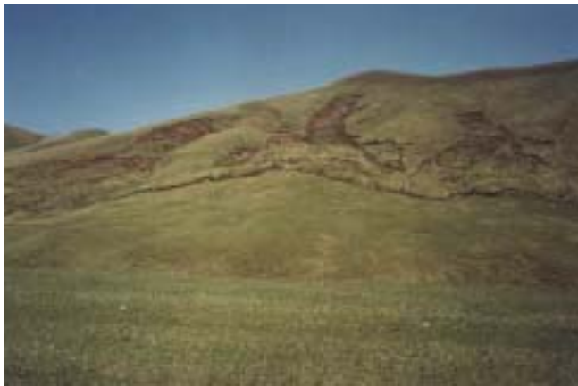
Зарождающиеся оползневые процессы

Раньше в Кыргызстане, одной из основных животноводческих республик бывшего Советского Союза, скот содержался на пастбищных участках, закрепленных за колхозами и совхозами. Каждое хозяйство четко знало границы своих пастбищных угодий и использовало их посезонно в зависимости от высоты над уровнем моря и сроков вегетации растительности. В настоящее время вновь образовавшиеся мелкие крестьянские (фермерские) хозяйства выпасают скот бессистемно на пастбищах, расположенных вблизи населенных пунктов (присельных пастбищах), причем эти пастбищные участки за ними юридически не закреплены. В связи с этим присельные пастбища из-за чрезмерной нагрузки деградируют, в то же время отдаленные (отгонные) пастбища крестьянскими (фермерскими) хозяйствами используются в незначительном количестве. Такое неравномерное размещение скота на пастбищах ведет к дальнейшей интенсивной деградации присельных пастбищных участков.