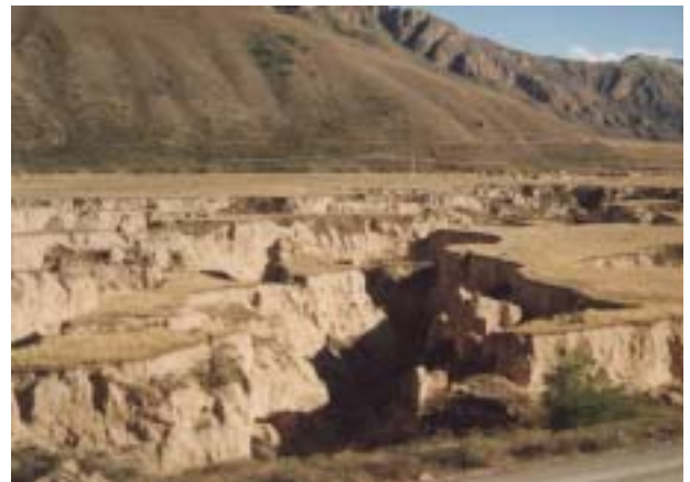
Антропогенные и природные эрозионные процессы

Как показали результаты мониторинга пастбищ, проведенного специалистами проектного института «Кыргызгипрозем», различным степеням деградации подверглись не только присельные, но и отдельные массивы горных и высокогорных пастбищ, что является следствием большой пастбищной нагрузки и неправильного использования на протяжении многих лет. Всего площадь деградированных пастбищных угодий в Кыргызской Республике (засоренных, сбитых, эродированных в разной степени) составляет более 3 222 тысяч гектаров или 29% от их общей площади.