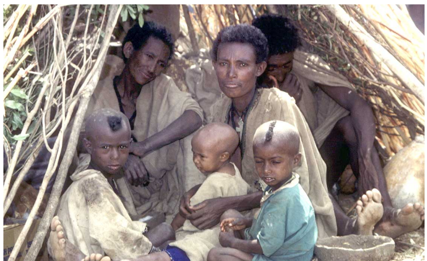
Un effort de collaboration aidera les pays de la corne de l'Afrique à éviter des désastres tels que la famine qui s'est produite il y a 15 ans.

L'Équipe spéciale interinstitutions doit maintenant aider les pays de la région – Djibouti, Érythrée, Éthiopie, Kenya, Ouganda, Somalie, et Soudan – à préparer des Plans d'action spécifiques par pays. Ces Plans d'action nationaux