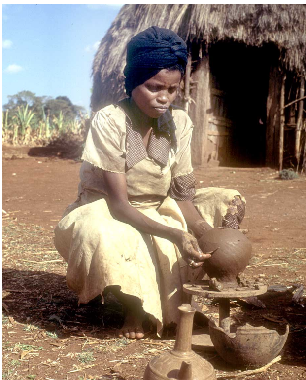
Pour cette femme éthiopienne, la poterie constitue un moyen de subsistance alternatif.

Tous les pays de la corne de l'Afrique ont besoin de meilleurs systèmes de transport, de réseaux de communication améliorés utilisant la technique des satellites et d'investissements dans l'irrigation. Parallèlement, les gouvernements doivent renforcer les services publics dans leur ensemble, y compris la fourniture de services sociaux de base concernant la santé et l'enseignement, et les institutions nationales pour la recherche agricole.