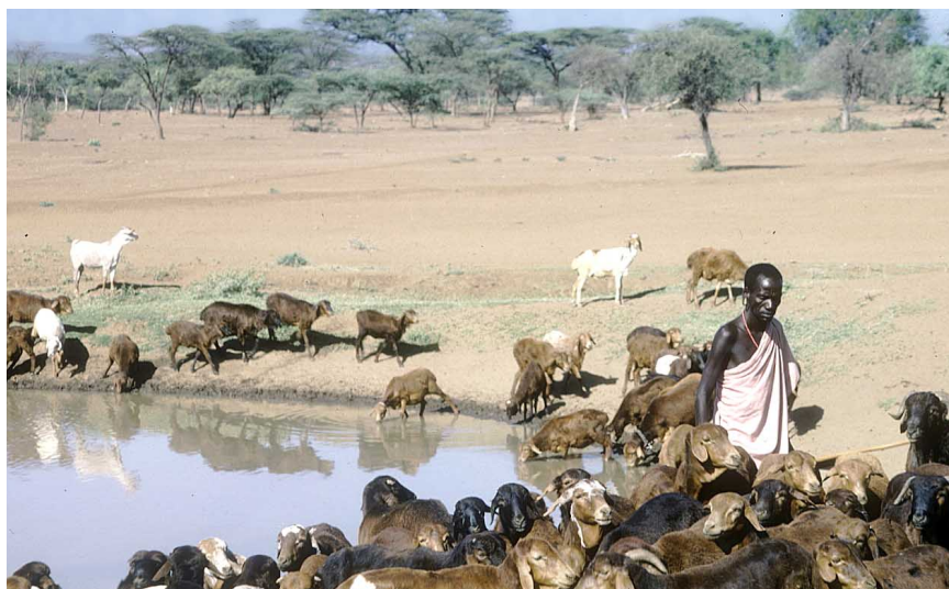
Certains projets formulés pour améliorer la productivité ont réduit la capacité des éleveurs de faire front à la sécheresse. (FAO 10941, F. Mattioli, Kenya 1983)

Bien qu'il progresse, le développement économique de ces pays est encore insuffisant pour que les pauvres puissent en bénéficier, et l'aide ne permet pas de combler