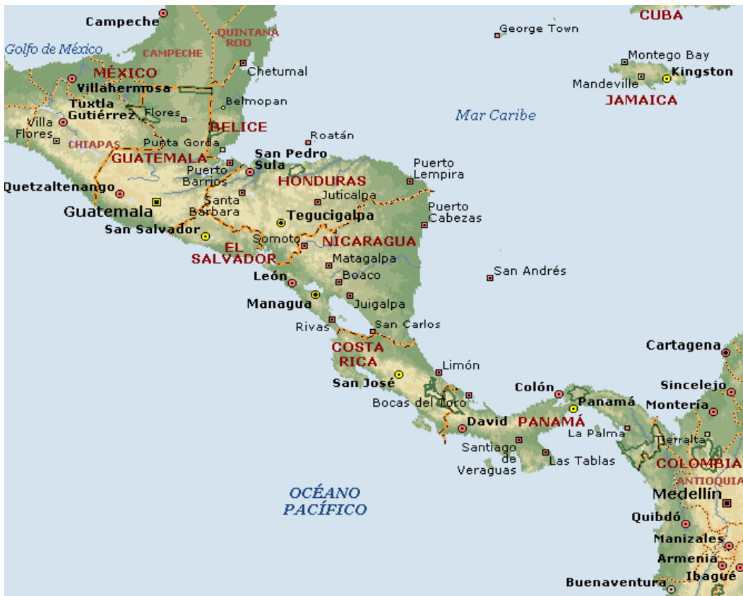
Figura 2. Mapa de Centroamérica