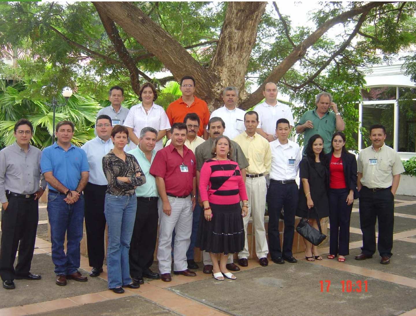
Participantes en el Taller Regional, Managua, Nicaragua