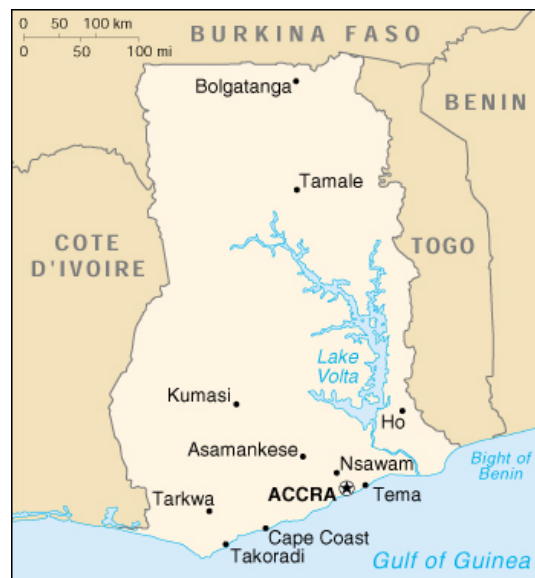
Figure 1. Carte du Ghana

L'élevage est une composante majeure de l'agriculture du Ghana et contribue largement à répondre aux besoins alimentaires, fournissant en outre de la force de traction, du fumier pour maintenir la fertilité des sols et des revenus monétaires, en particulier pour les producteurs du nord du pays. Le secteur de l'élevage représente, en termes de produits directs, environ 7% du PIB agricole (SRID, 2001), le fumier et la traction animale étant exclus et dévolus au secteur des cultures. L'élevage des ruminants joue un rôle majeur dans la vie socioculturelle des communautés rurales car il détermine en partie la richesse et le paiement de la dot, et fait fonction de banque et d'assurance en temps de difficulté. Ovins et caprins sont souvent abattus lors des occasions telles que naissances, enterrements et mariages (MoFA, 1990).