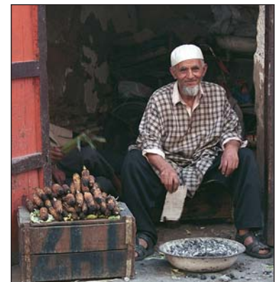
Les activités informelles alimentaires sont une source importante de revenus pour les ménages pauvres.

Séminaire sous-régional FAO-ISRA «Approvisionnement et distribution alimentaires des villes de l'Afrique francophone», 17 avril 1997.