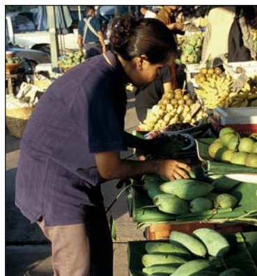
Retail market in central Bangkok. Markets need space and facilities to reduce food losses and avoid contamination.