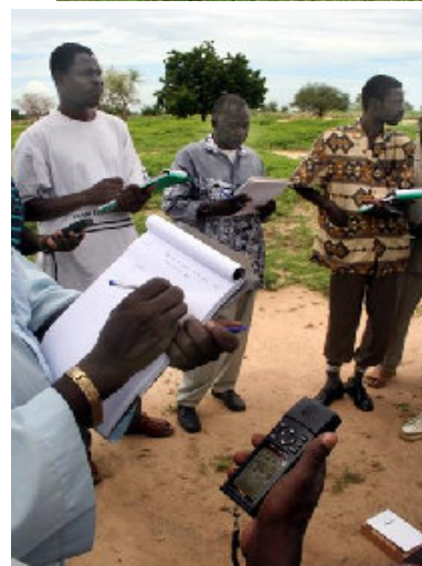
Formation théorique sur GPS au Tchad