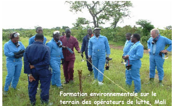
Formation environnementale sur le terrain des opérateurs de lutte, Mali

La situation acridienne est généralement calme dans les zones de reproduction estivale du Sahel d'Afrique de l'Ouest. Malgré de bonnes pluies et des conditions écologiques inhabituellement bonnes, seuls quelques ailés isolés ont été détectés par des prospections intensives en Mauritanie , au Mali et au Niger . Quelques ailés épars ont été récemment signalés dans le sud-ouest de la Libye , près de Ghat. Les précédentes infestations par des bandes larvaires le long des deux côtés de la frontière entre le Tchad et le Soudan ont diminué mais il subsiste un faible risque que de petits groupes d'ailés ou de petits essaims puissent se former dans l'est du Tchad et dans le Darfour, au Soudan . Il a aussi été indiqué que les infestations ont diminué dans les plaines côtières de la mer Rouge, en Erythrée . Néanmoins, des prospections intensives doivent être maintenues dans tous les pays en septembre et en octobre afin de déceler tout signe d'augmentation des populations de Criquet pèlerin.