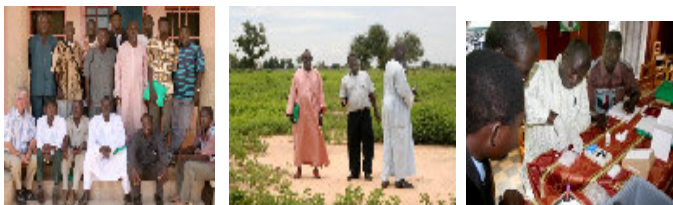
La formation QUEST au Tchad