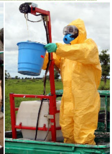
Calibrage de l'équipement de traitement au Tchad