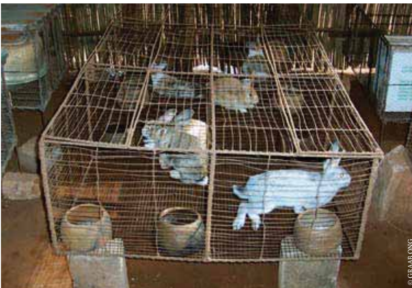
Chacune des femmes a reçu un kit d'élevage consistant en deux cages à quatre compartiments, huit mangeoires, huit abreuvoirs, un seau en plastique, un coupe-coupe et quatre lapins.

GRAAB ONG Martin Tohou, Directeur exécutif BP 2355 Goho (Abomey) République du Bénin Tél : +229 95 42 88 19 E-mail : graabta@yahoo.fr