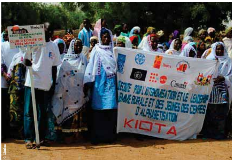
Les membres du club d'écoute de Kiota lors de la cérémonie de lancement du projet à Dantiandou en juin 2010.

Rapidement, le succès et les sollicitations étaient tels que des moyens de communication complémentaires ont été mis à disposition des clubs. Une centaine de téléphones portables supplémentaires ont été répartis dans les clubs d'écoute. Ces téléphones ont été mis en liaison selon une formule de réseau appelée « flotte » qui permet aux clubs et aux radios de communiquer gratuitement et à tout moment.