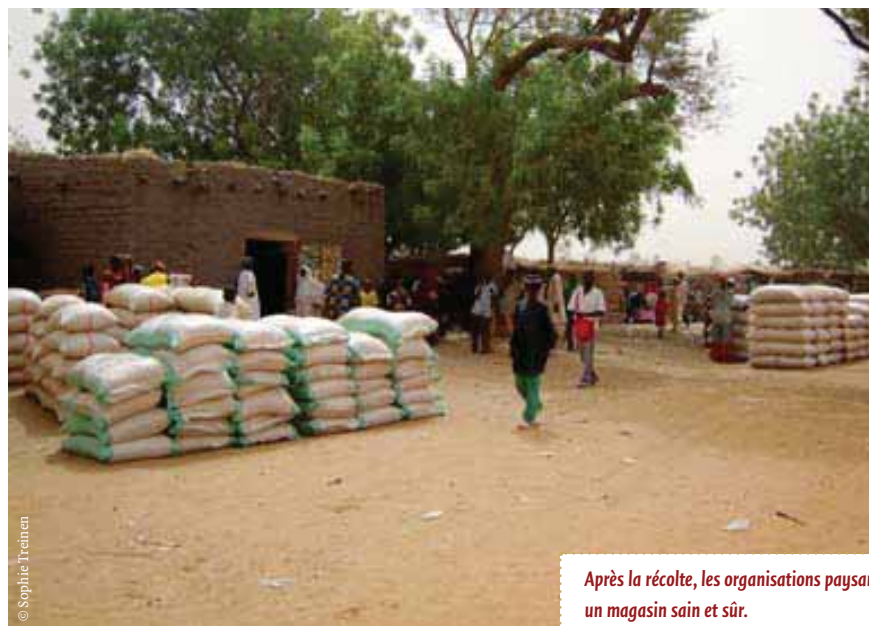
Après la récolte, les organisations paysannes stockent les produits agricoles de leurs membres dans un magasin sain et sûr.

Une solution à ce problème a été introduite au Niger par le projet Intrants de la FAO en faisant appel au warrantage. En novembre/décembre, juste après la récolte, les organisations paysannes (OP) stockent divers produits agricoles de leurs membres dans un magasin sain et sûr. La banque, généralement une institution de finance rurale (IFR), vérifie alors la quantité et la qualité des stocks. Le magasin est fermé avec deux cadenas, l'un pour la banque, l'autre pour l'OP. La banque accorde un crédit équivalent à 80% du prix à la récolte du stock constitué. Ce crédit est distribué à chaque membre au pro rata de son apport dans le stock. Avec le crédit obtenu, les producteurs et productrices réalisent une activité génératrice de revenu (AGR) : embouche, maraîchage, transformation, commercialisation. En mai, grâce aux résultats de l'AGR entreprise, chaque membre rembourse son crédit à son OP qui, elle-même, rembourse à la banque qui libère le stock en rendant sa clé. Les membres ont alors gagné sur deux tableaux : le stock qui a augmenté de valeur et les bénéfices de l'AGR. On estime que ce système génère une augmentation de revenu de 30%.