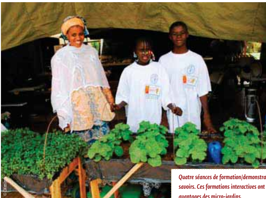
Quatre séances de formation/démonstration sur le micro-jardinage ont été réalisées à la Foire aux savoirs. Ces formations interactives ont permis aux participants de découvrir par eux-mêmes les avantages des micro-jardins.