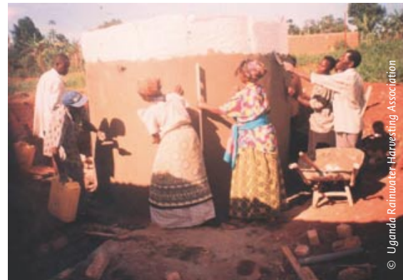
Photo 1 – La tâche d'aller chercher l'eau est en principe réservée aux femmes. URWA essaye de renforcer les capacités des femmes à résoudre leurs problèmes d'eau grâce à des formations en construction de réservoirs.