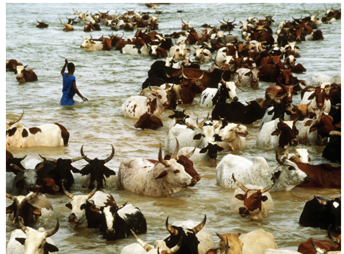
Diaraf, Mali. Le bétail est encore largement convoyé par des bergers à pied, faute de routes suffisantes, d'un parc de véhicules de qualité et d'une bonne organisation de la filière.