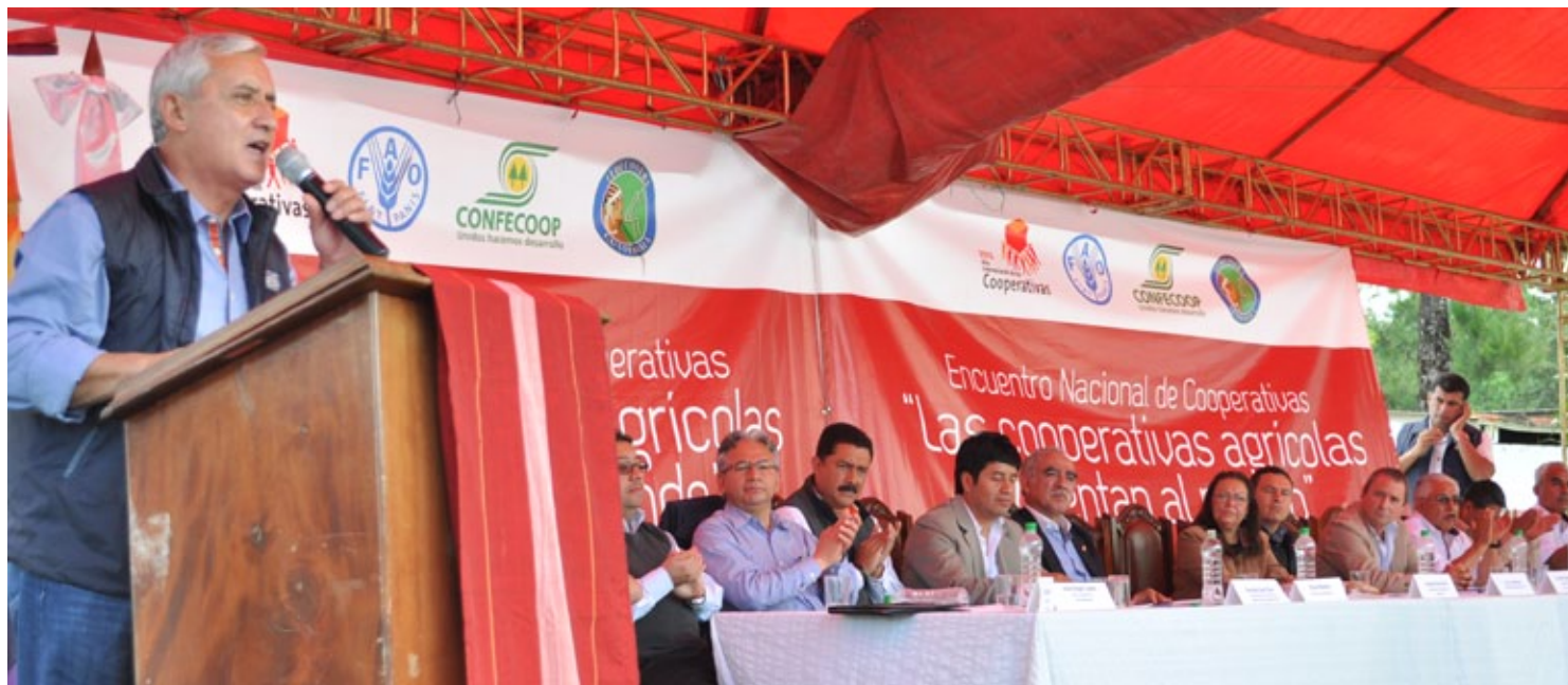
El Señor Presidente de Guatemala, Otto Pérez Molina ofrece su discurso en conmemoración del Encuentro Nacional de Cooperativas.

La Organización de las Naciones Unidas para la Alimentación y la Agricultura (FAO), la Confederación Guatemalteca de Federaciones de Cooperativas (CONFECOOP) y la Federación de Cooperativas de las Verapaces (FEDECOVERA) celebraron en las instalaciones de la cooperativa Chicoj un Encuentro Nacional de Cooperativas “Las cooperativas agrícolas alimentan al mundo” en el que se reconoció la importante contribución que el cooperativismo hace a la seguridad alimentaria, especialmente en Guatemala.