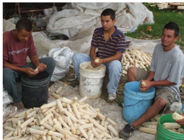
En dos ciclos de producción y comercialización de semillas se han generado de 23 000 jornales y la inyección a la economía de 6 millones de quetzales aproximadamente.