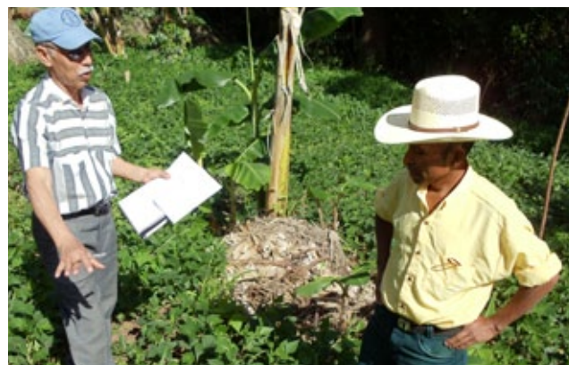
El proceso de certificación de la semilla esta a cargo de la Dirección de Fitozoogenética y Recursos Nativos del VISAR - MAGA que son actores importantes en el Comité Técnico Nacional, donde además participa el Departamento de Granos Básicos del VIDER - MAGA y el ICTA.