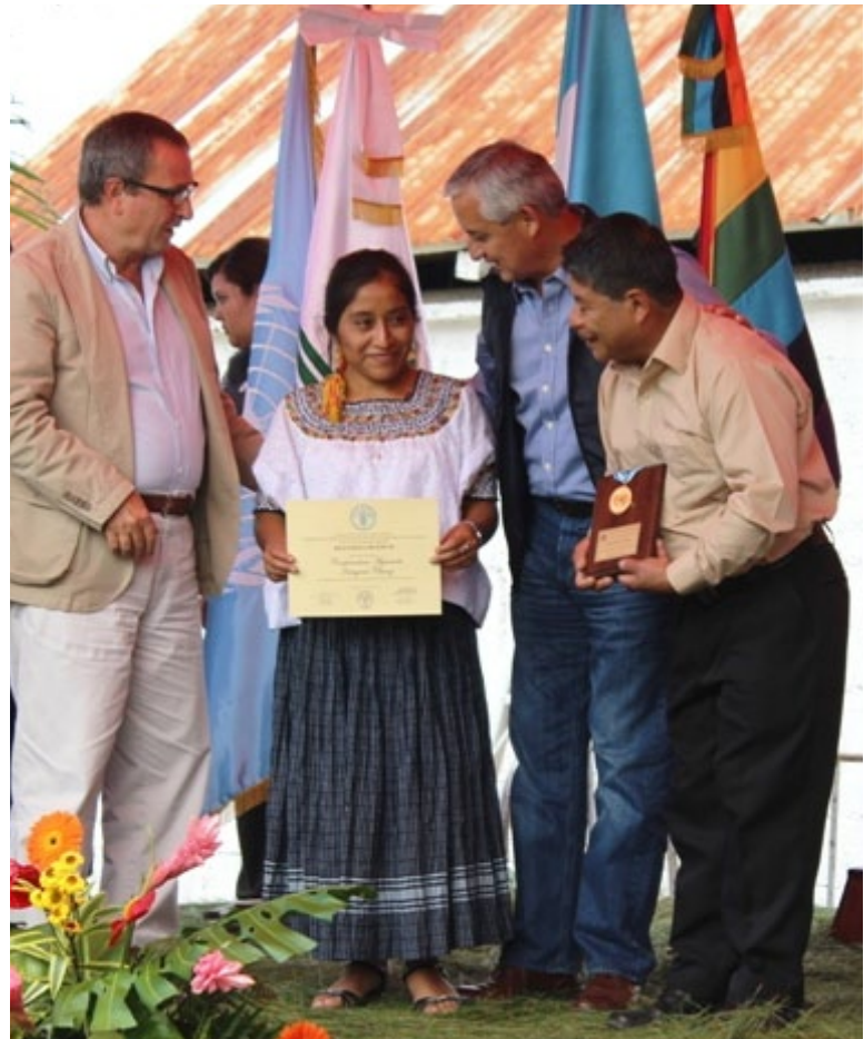
El Señor Presidente de Guatemala, Otto Pérez Molina junto con Ernesto Sinópoli hace entrega de la medalla ONU a la cooperativa Chicoj.

Los servicios prestados por las federaciones a sus miembros incluyen por lo general financiamiento, representación, asistencia técnica, capacitación, elaboración de proyectos, formación de líderes y formación empresarial, particularmente para actividades rurales. Estas 13 federaciones aglutinan a los diferentes tipos de cooperativas que forman parte del sector cooperativo guatemalteco.