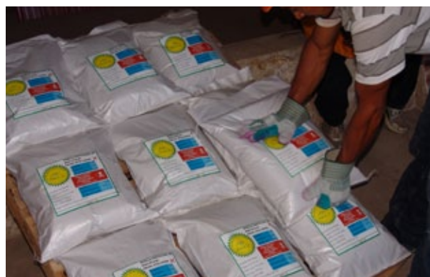
Con la ejecución de planes de venta se han comercializado 8 000 quintales (qq) de semilla de maíz ICTA B-7 y 1 600 qq de ICTA Ligero en frijol

El proyecto "Semillas para el Desarrollo" contribuye al fortalecimiento de los sistemas nacionales sostenibles que aseguren disponibilidad y acceso a semillas de buena calidad de granos básicos para los pequeños productores en el marco de la seguridad alimentaria y nutricional (SAN) y la agricultura familiar de Guatemala.