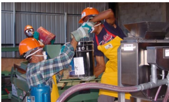
El acondicionamiento de las redes semilleras, en las 3 plantas regionales (ASEJO para la REDSZACHI y ATESCATEL y APALH para la REDSSOR) coadyuva al fortalecimiento del sistema nacional sostenible de semillas.