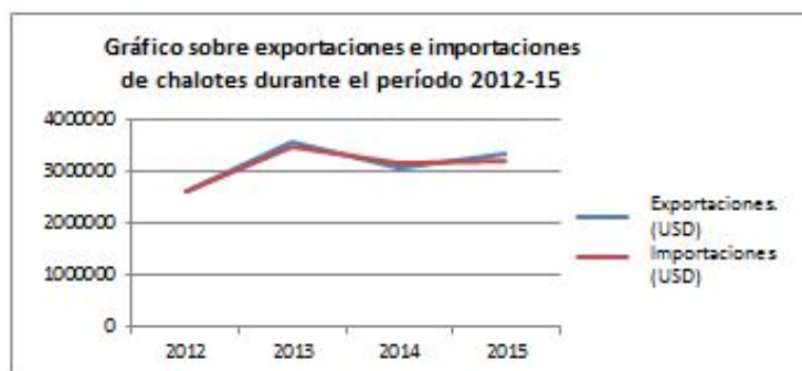
Figura 1: Tendencia del comercio de chalotes

Sobre la base de los datos anteriores, en el gráfico que figura a continuación se puede observar que, en general, la tendencia en el comercio de chalotes ha ido en aumento. El volumen de exportaciones fue superior al de importaciones. La tendencia de comercio aumentó durante ese período. El crecimiento medio de las exportaciones de 2011 a 2014 fue del 8,4 % y el crecimiento medio de las importaciones, del 8,14 %. Sin embargo, la tendencia del valor de las reexportaciones disminuyó de 2012 a 2015, con un crecimiento anual medio del -1,83 %.