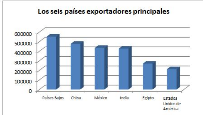
Figura 3: Principales países exportadores de chalotes

Sobre la base de los datos de COMTRADE por país individual, los Países Bajos fueron el mayor país exportador de chalotes, seguido de China, México, la India, Egipto y los Estados Unidos de América, entre otros. Aunque China fue el mayor productor de chalotes, no se convirtió en el mayor país exportador. Tal vez la demanda interna de chalotes también era elevada, ya que la mayoría de los países orientales utilizan los chalotes como ingrediente alimentario. Esto hizo que China no se convirtiera en el mayor país exportador de chalotes. Por otro lado, los Estados Unidos de América fueron el mayor país importador de chalotes. En 2015, el valor de las importaciones fue de 439 820 USD. Por detrás se situaron el Reino Unido (212 754 USD), Malasia (210 506 USD), Alemania (158 062 USD), Arabia Saudita (146 015), el Japón (139 854 USD) y otros países.