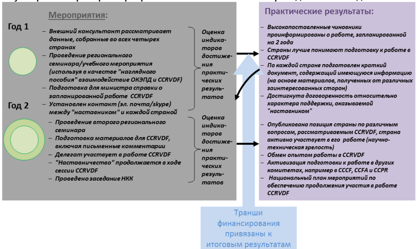
Рисунок 3: Более подробная схема реализации регионального двухлетнего проекта ЦФК-2