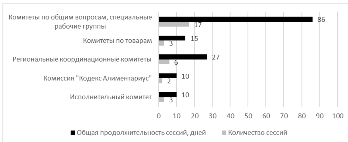
Рис. 2: Количество и продолжительность очных сессий Кодекса и его органов, состоявшихся в 2018 и 2019 годах

17. Помимо приведенной в настоящем документе информации об освоении бюджета, правительства стран, принимающих комитеты Кодекса, в течение двухгодичного периода израсходовали на обслуживание этих комитетов до 6 млн долл. США. В зависимости от места проведения, продолжительности, обеспечения письменного и устного перевода и пр., расходы по одним сессиям могут достигать до 500 000 долл. США в год, а по другим составлять всего лишь 50 000 долл. США.