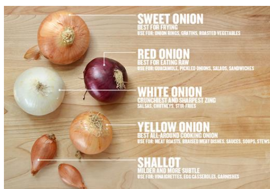
Figura 3. Tipos de plantas de cebolla

Se espera que el desarrollo de la norma se lleve a cabo en tres reuniones del CCFFV o menos, dependiendo de las contribuciones correspondientes y el acuerdo de los miembros.