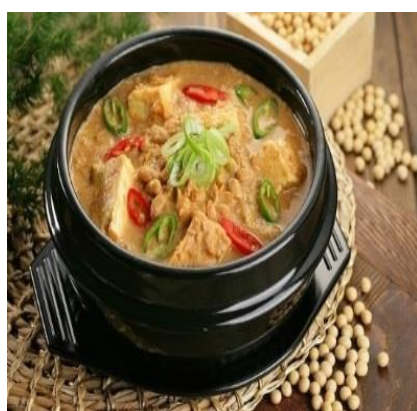
Суп с Cheonggukjang