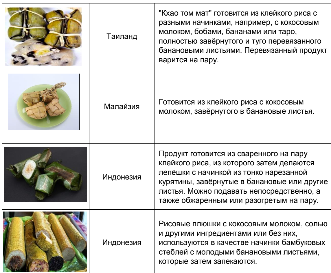
Таблица 1. Сходные продукты на мировом рынке