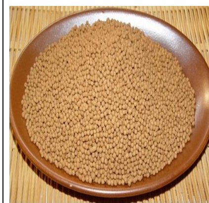
Cheonggukjang в виде гранул

Cheonggukjang в сыром виде (несоленый): смешивается с другими приправами и овощами и употребляется без дальнейшей обработки.