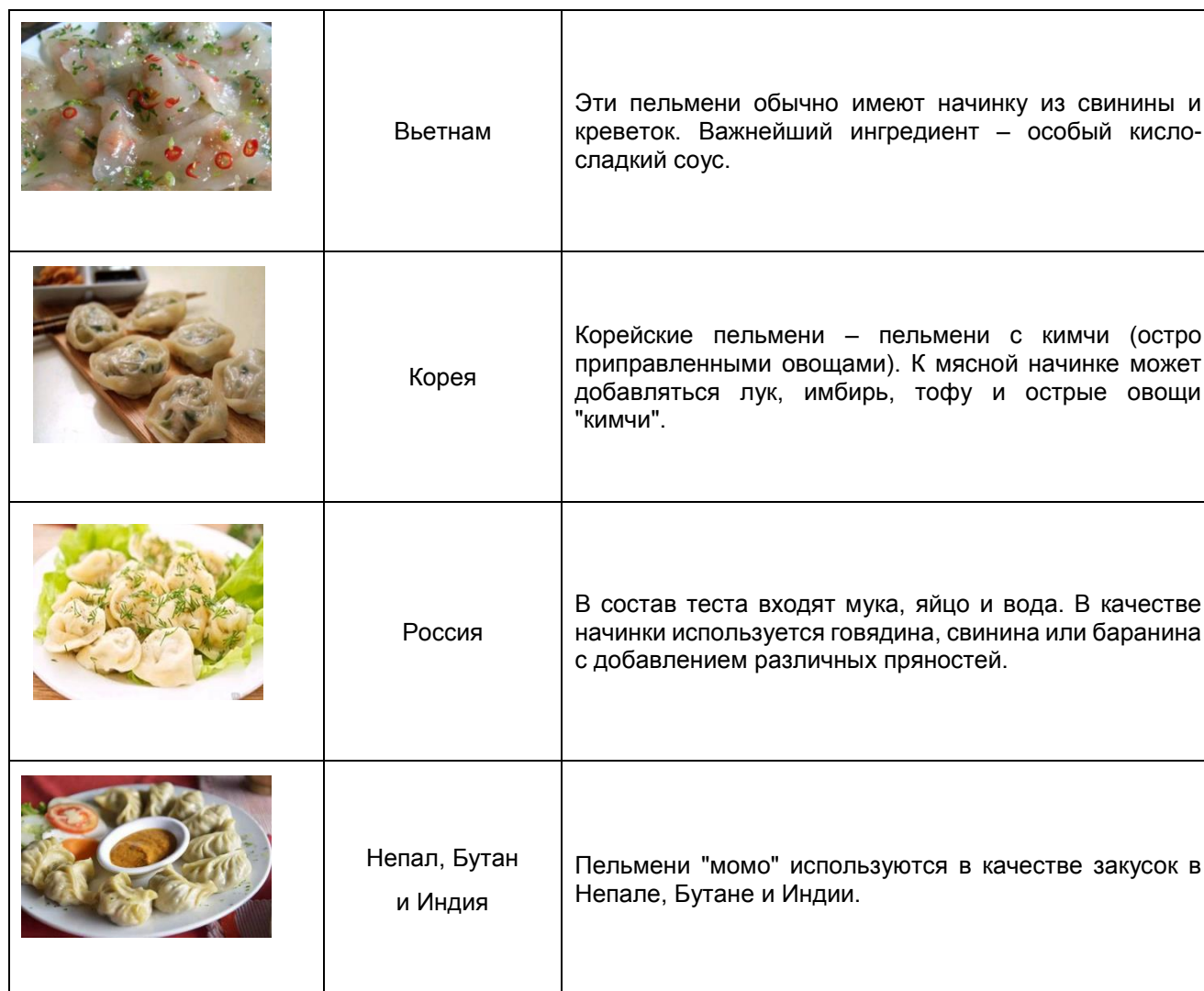
Таблица 1. Различные способы приготовления пельменей в разных странах

Быстрозамороженные пельмени очень популярны в Китае и других частях мира. Похожие пельмени имеются в Японии, Соединённых Штатах Америки, Германии, Польше, России, Непале и других странах. В разных странах пельмени готовятся по-разному, со своими особенностями, однако все они готовятся из пшеничной или другой богатой крахмалом муки, на основе которой делается тесто, с начинкой из мяса, яйца или овощей и других продуктов.