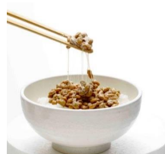
Продукт на рисе