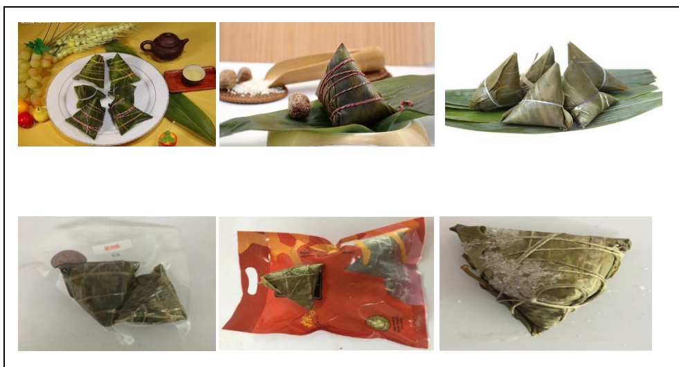
Рисунок 2. Разные виды китайских "цзунцзы"

Разные виды китайских "цзунцзы" показаны на рисунке 2.