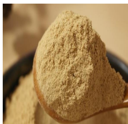
Cheonggukjang в виде порошка