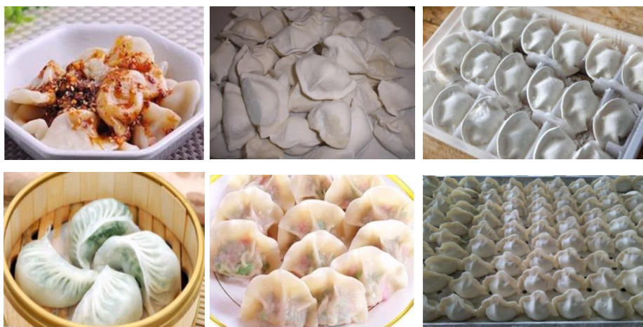
Рисунок 1. Различные виды пельменей в Китае

В Китае существуют различные виды пельменей (см. рисунок 1).