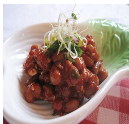
Cheonggukjang в сыром виде