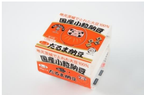
Продукт в таре для розничной продажи