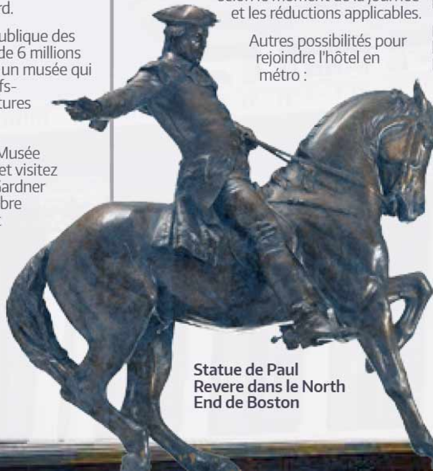
Statue de Paul Revere dans le North End de Boston

Elles appliquent un tarif forfaitaire qui comprend les péages, les taxes et le pourboire du chauffeur. Ces tarifs forfaitaires sont structurés comme suit : Heure de pointe (jours de semaine uniquement) : 7h00 – 9h00 et 15h30 – 18h30 30$ par taxi (1 à 4 passagers). Autres horaires, y compris le week-end : 26,25$ par taxi (1 à 4 passagers), le tarif est un peu plus élevé pour les minibus et les breaks. Tous ces tarifs sont variables.