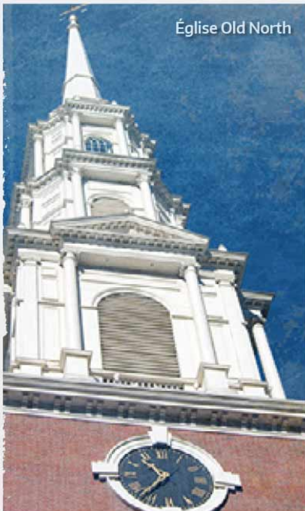
Église Old North

Voici quelques exemples des nombreuses activités et attractions que Boston peut vous offrir :