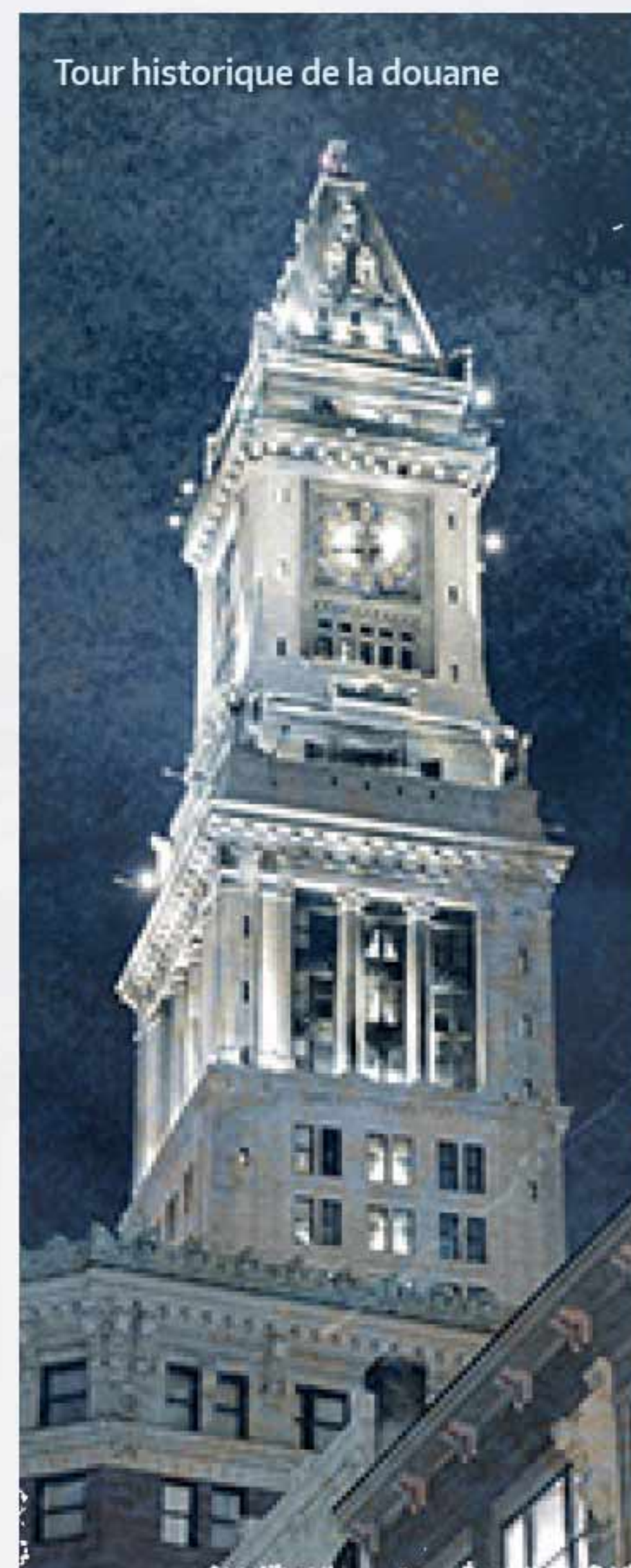
Tour historique de la douane

L'obtention d'un visa pour les États-Unis est un processus qui comporte plusieurs étapes et peut prendre du temps. Les délégués sont fortement encouragés à s'adresser dès maintenant à l'ambassade ou au consulat des États-Unis le plus proche, pour savoir s'ils ont besoin d'un visa et, le cas échéant, quelle est la procédure à suivre. Le Bureau du Codex des États-Unis n'a aucune influence sur la procédure d'obtention d'un visa ; toutefois, il vous prêtera assistance autant que possible, en fournissant par exemple un certificat d'inscription. La responsabilité d'entreprendre la procédure dans les délais incombe aux délégués. Les délégués qui n'auraient pas pris leurs dispositions bien avant le lancement de la Session pourraient ne pas obtenir leur visa à temps pour participer aux réunions.