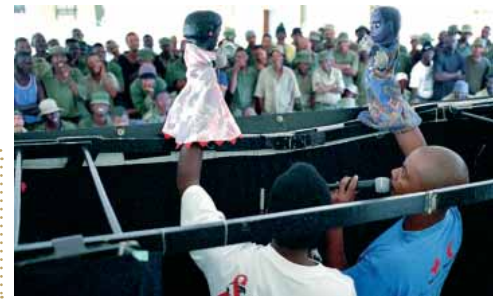
Un spectacle de marionnettes dans la prison de Windhoek (Namibie)

exemple de support traditionnel pouvant être utilisé afin d'exprimer des idées et d'aborder des questions souvent trop délicates pour être attaquées de front. C'est pour cette raison que les marionnettes peuvent se révéler très efficaces pour aborder la question hautement sensible du VIH-SIDA. Nous vous présentons ici quelques exemples d'initiatives en cours.