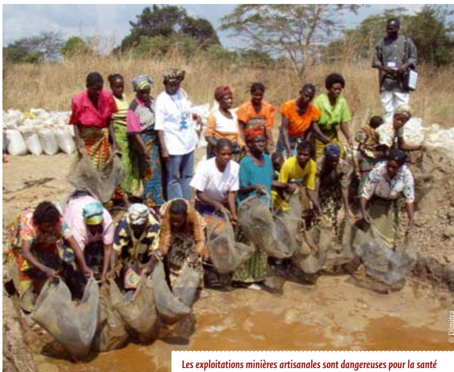
Les exploitations minières artisanales sont dangereuses pour la santé et la sécurité des femmes et enfants qui y travaillent.