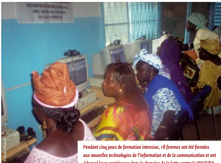
Pendant cinq jours de formation intensive, 18 femmes ont été formées aux nouvelles technologies de l'information et de la communication et ont échangé leurs expériences dans le domaine de la lutte contre le VIH/SIDA dans les zones rurales.

Les échanges ont jeté un nouvel éclairage sur les défis interdépendants posés par la double épidémie du VIH/SIDA et de l'insécurité alimentaire. Certains thèmes clés récurrents