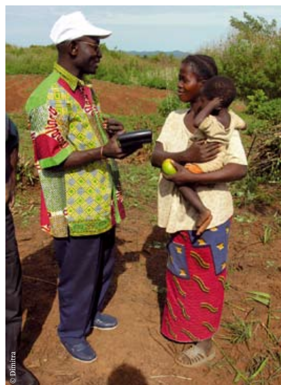
Les femmes rurales ont créé des clubs d'écoute, afin de pouvoir exprimer leurs opinions et leurs besoins.

La fréquence des échanges au sein des axes de communication et la diversité des sujets débattus a donné naissance à des collectifs de femmes rurales, regroupant les organisations œuvrant pour les femmes dans les territoires