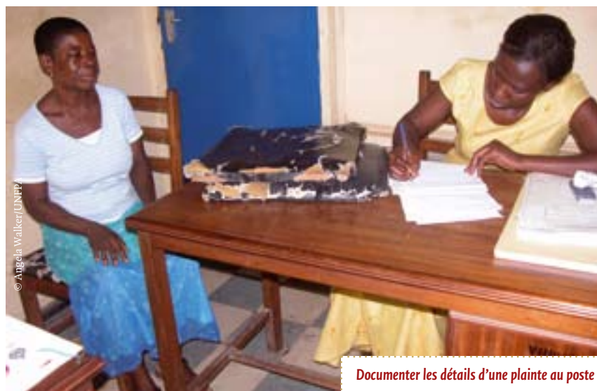
Documenter les détails d'une plainte au poste de police.

* Résumé d'un article par Angela Walker, UNFPA 20 novembre 2007 www.unfpa.org/news/news.cfm?ID=946&NewsType=2&Language=3