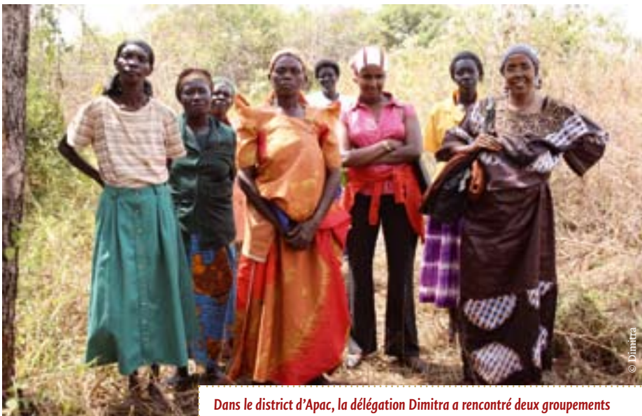
Dans le district d'Apac, la délégation Dimitra a rencontré deux groupements de femmes, qui ont parlé de leurs activités et projets mis en route depuis leur association avec le centre d'information de Kubere (KIC) de WOUNNET.

Dans le district d'Apac, le groupe a rencontré deux des douze groupes de femmes appuyés par le centre d'information de Kubere de WOUNNET (KIC, cf. article précédent): l'Orib Can Women's Group de la paroisse d'Atana, comté de Maruzi et le St Luke's Women's Group de la paroisse d'Adyeda, comté de Kole. En dépit de leur nom, ces groupes de femmes comptent également des hommes parmi leurs membres actifs et ils participent, eux aussi, aux réunions.