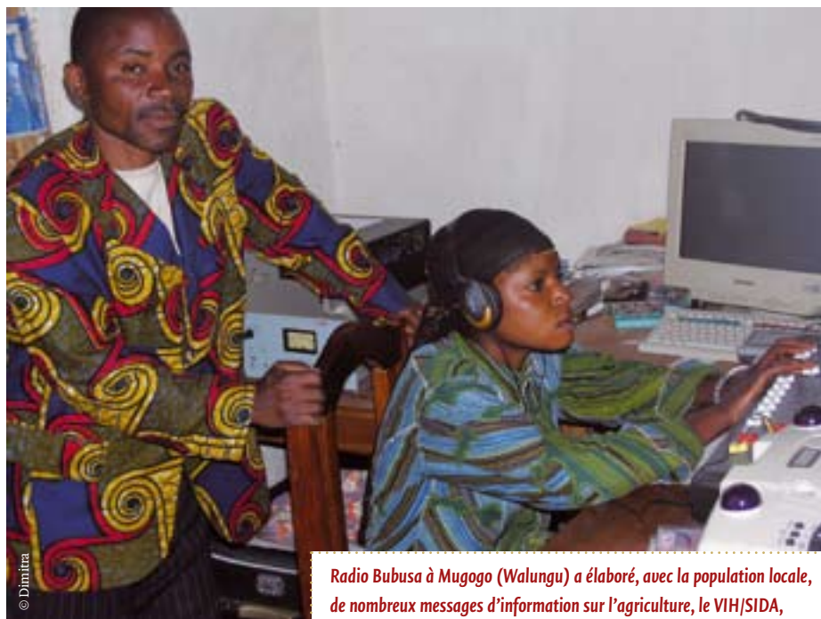
Radio Bubusa à Mugogo (Walungu) a élaboré, avec la population locale, de nombreux messages d'information sur l'agriculture, le VIH/SIDA, la lutte contre les violences sexuelles, le statut des femmes, etc.

Egalement grâce à une émission de radio, les membres du club d'écoute Ruhinduke de Mugogo ont été mis au courant d'une double initiative des femmes de Fizi, consistant en la création d'une caisse d'entraide pour femmes et la fabrication de tuiles ondulées par les fem-