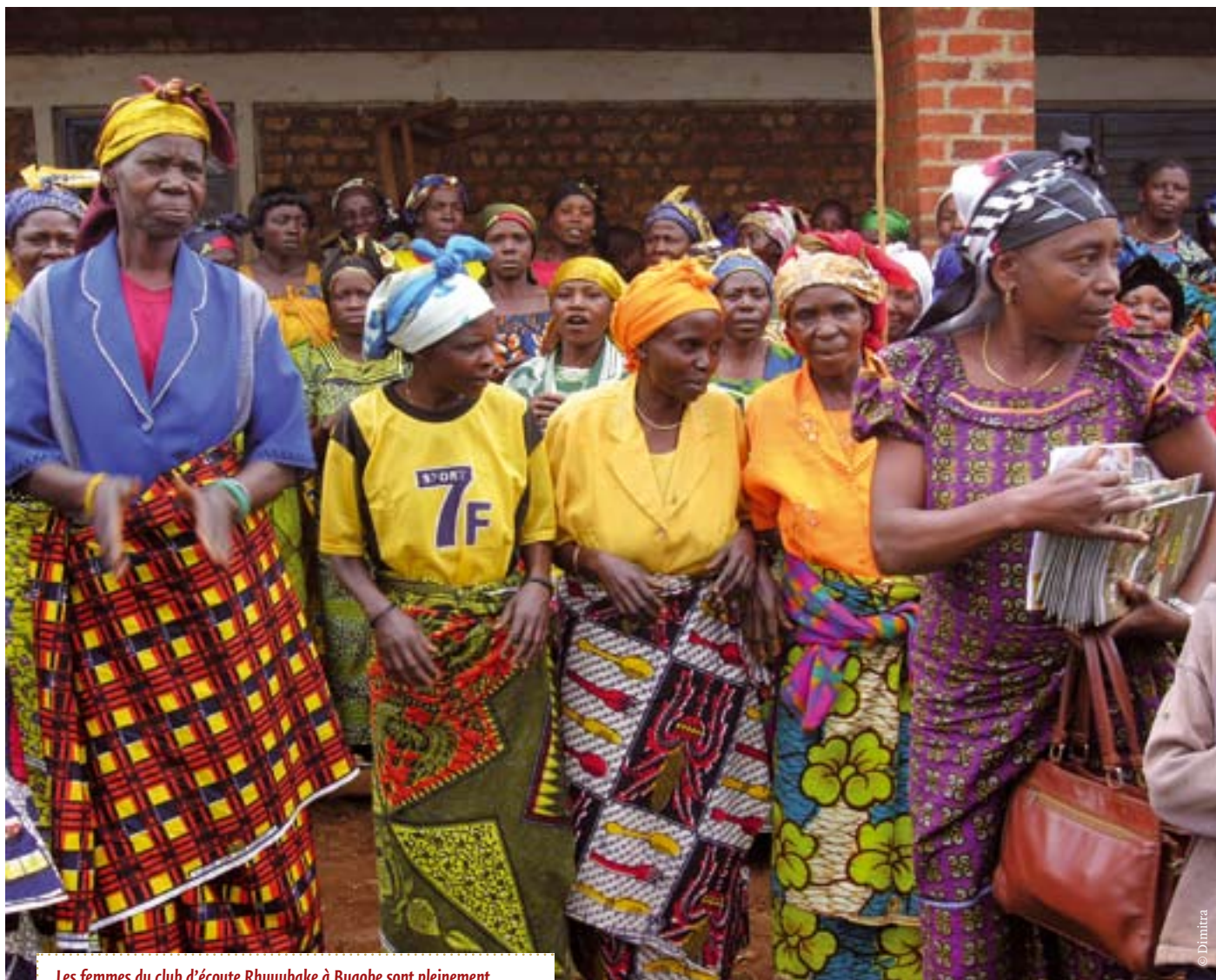
Les femmes du club d'écoute Rhuyubake à Bugobe sont pleinement engagées dans leur nouveau rôle d'actrices du changement.

vision du VIH/SIDA. Ils ont analysé ensemble les comportements, attitudes et croyances des hommes et des femmes par rapport à cette maladie. C'est sur la base de ces discussions que tous les messages de prévention sont maintenant élaborés – on sait qu'ils ont un véritable sens pour la population car elle les a élaborés elle-même. SAMWAKI et la GTZ-Santé assurent ensuite que les messages et les informations fournis sont corrects et fiables.