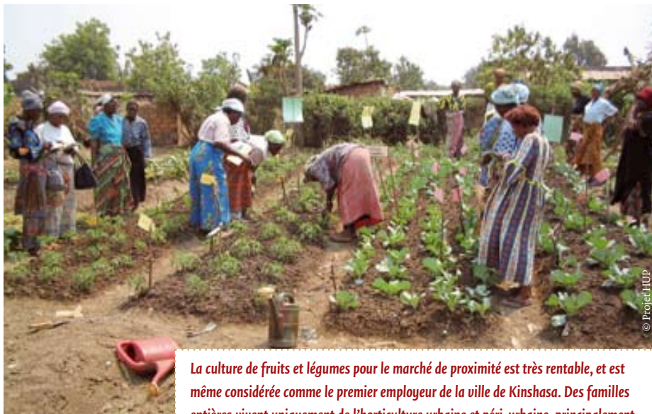
La culture de fruits et légumes pour le marché de proximité est très rentable, et est même considérée comme le premier employeur de la ville de Kinshasa. Des familles entières vivent uniquement de l'horticulture urbaine et péri-urbaine, principalement conduite par les femmes.