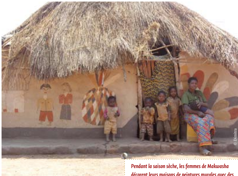
Pendant la saison sèche, les femmes de Makwasha décorent leurs maisons de peintures murales avec des pigments naturels.

Les femmes du village pratiquent des cultures maraîchères et vivrières qui suffisent tout juste à nourrir la communauté. Pourtant la terre est fertile, et l'eau n'est pas loin. Mais tout est difficile car il n'y a pas de points d'eau aménagés. Les jeunes filles creusent des puisards ici et là, près des jardins potagers d'où elles retirent l'eau avec une cuvette pour remplir des seaux ou des bidons. Le transport de l'eau prend une grande partie du temps des filles qui transpor-