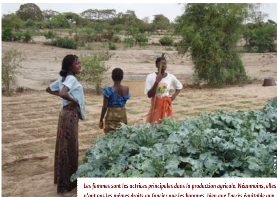
Les femmes sont les actrices principales dans la production agricole. Néanmoins, elles n'ont pas les mêmes droits au foncier que les hommes, bien que l'accès équitable aux ressources soit une condition indispensable pour le développement durable.

Au Sénégal , l'article 15 de la Constitution (2001) garantit le droit à la propriété et à la terre aux hommes comme aux femmes. Les restrictions coutumières et religieuses à l'accès de la