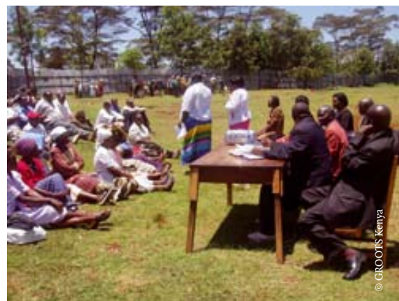
Sensibilisation des femmes leaders à Gatundu sur le rôle des groupes de surveillance pour la protection des droits des femmes à la terre et à la propriété.

De grands succès ont été enregistrés, en particulier avec le système du tutorat électronique. Par exemple, tandis que le bureau de médiation (groupe de personnes éminentes sélectionnées par la communauté pour apporter leur aide aux procédures de médiation) de la région de Gatundu ne disposait que d'un médiateur et