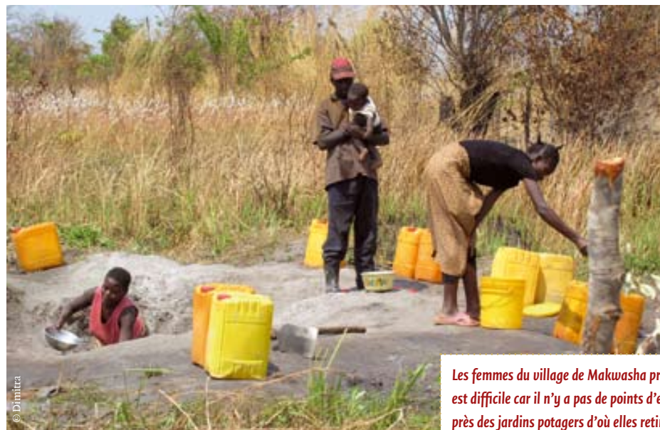
Les femmes du village de Makwasha pratiquent des cultures maraîchères et vivrières, mais leur travail est difficile car il n'y a pas de points d'eau aménagés. Les jeunes filles et femmes creusent des puisards près des jardins potagers d'où elles retirent l'eau avec une cuvette pour remplir des seaux ou des bidons.

* Le film « Kushiripa, un art féminin » est disponible en DVD auprès du Vicinos-Club : vicanosclub@yahoo.fr