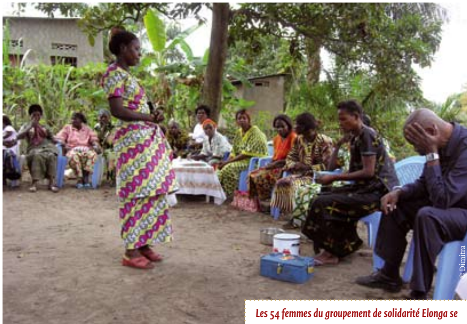
Les 54 femmes du groupement de solidarité Elonga se réunissent chaque semaine et cotisent pour pouvoir obtenir des crédits et faire des micro-projets ensemble.

L'argent est mis dans la caisse de l'association, qui est gardée par la présidente du Comité de Gestion. La caisse a trois cadenas, dont les clefs sont détenues par trois femmes membres de l'association, dont aucune ne sait qui a les