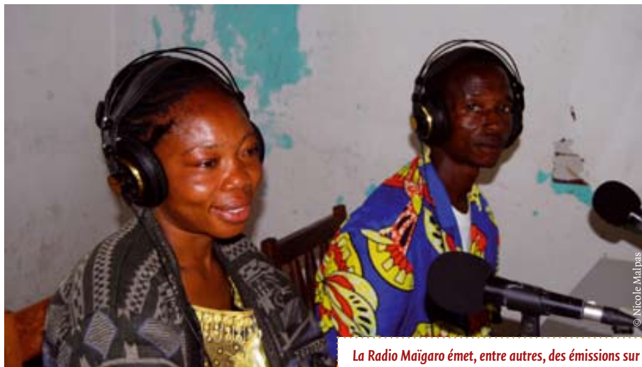
La Radio Maïgaro émet, entre autres, des émissions sur des sujets qui intéressent spécifiquement les femmes.