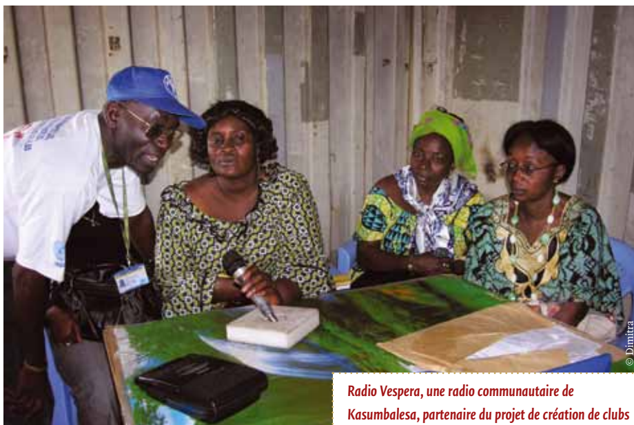
Radio Vespera, une radio communautaire de Kasumbalesa, partenaire du projet de création de clubs d'écoute.

Le thème genre et développement – comment intégrer l'égalité hommes-femmes dans tous les thèmes de développement – a été traité