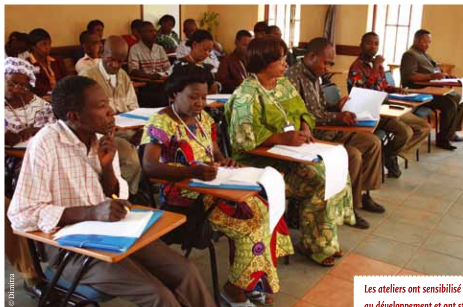
Les ateliers ont sensibilisé les participants aux notions de genre et de communication au développement et ont stimulé le travail en synergie et en réseau.