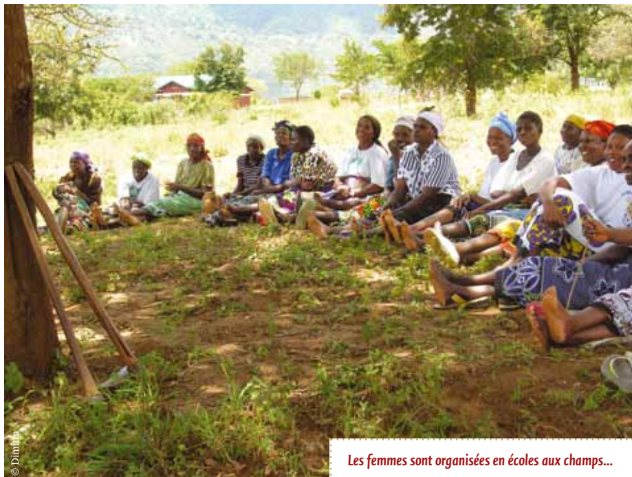
Les femmes sont organisées en écoles aux champs...

Cependant, dans de nombreux cas, les femmes qui n'ont pas le soutien de leur groupe et des facilitateurs des FFS ne savent pas où aller, ni à qui parler si les institutions locales ne répondent pas de manière appropriée à leurs revendications et à leurs demandes. Dans des communautés avec un taux de mortalité élevé dû au VIH, les femmes sont dépossédées de leurs biens, ce qui les laisse totalement démunies lorsque leur mari meurt ou qu'il prend une autre femme. Un grand nombre de femmes ne souhaitent pas affronter leur belle-famille et la communauté dans laquelle elles vivent, et préfèrent donc renoncer à se battre pour leurs droits fonciers.