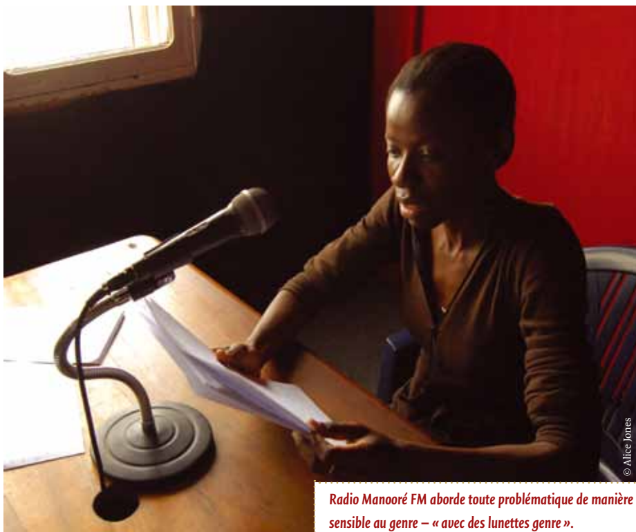
Radio Manoaré FM aborde toute problématique de manière sensible au genre – « avec des lunettes genre ».