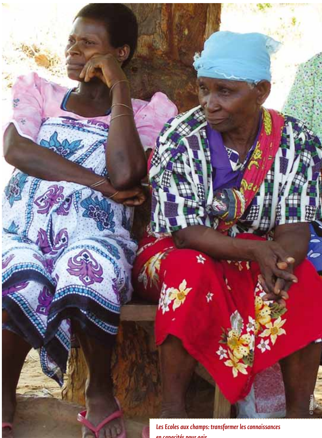
Les Ecoles aux champs: transformer les connaissances en capacités pour agir.

FFS, et ils ont réussi, en un laps de temps assez court, à économiser 100 000 shillings kenyans. Le prix du terrain est de 300 000 shillings kenyans, et comme ils disposent déjà d'un tiers de la somme en garantie, ils seront en mesure d'emprunter le reste auprès de la banque. Cette expérience a fortement impressionné les villages voisins, qui ont manifesté un vif intérêt de rejoindre les FFS et de faire la même chose.