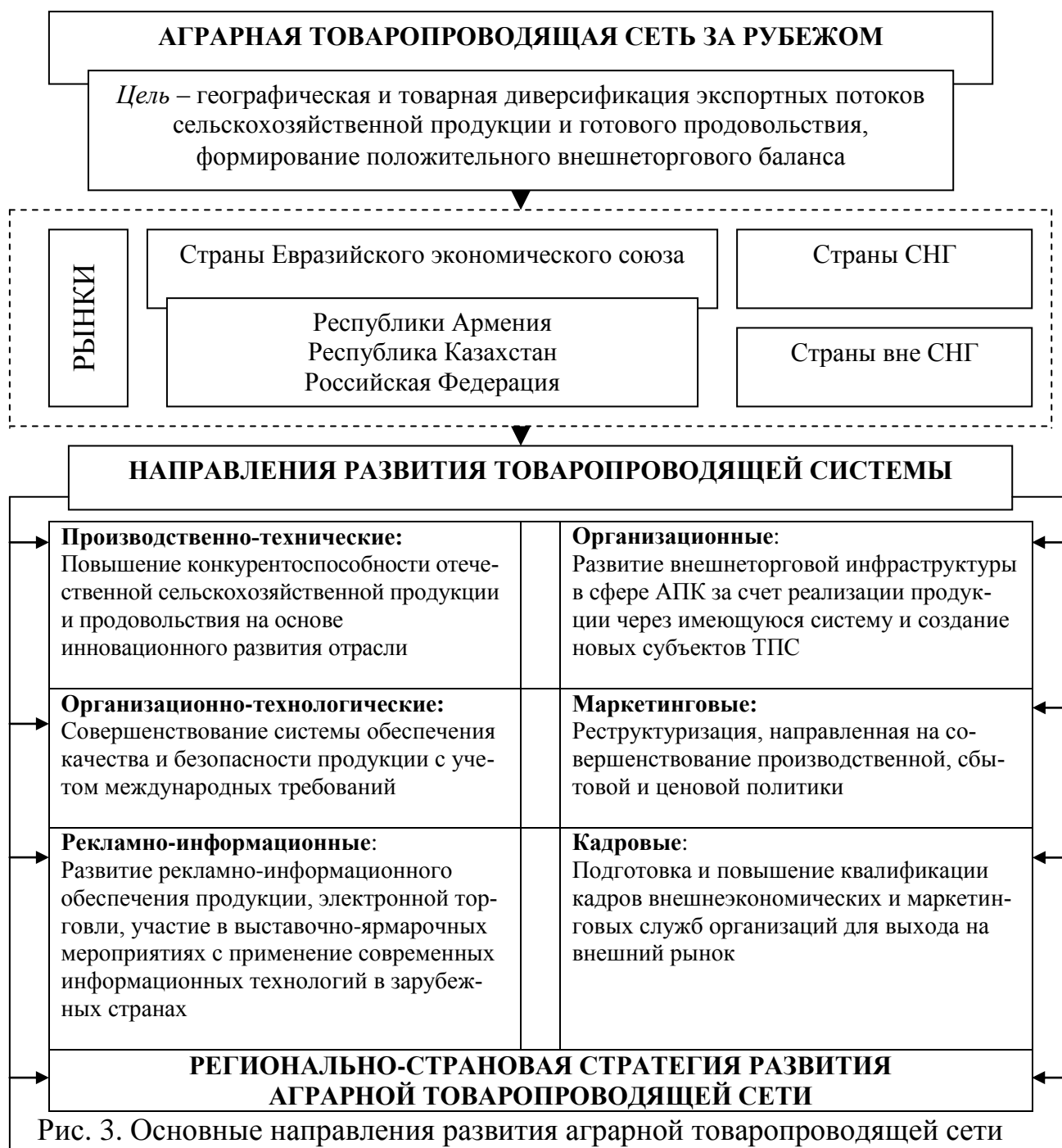
Рис. 3. Основные направления развития аграрной товаропроводящей сети на зарубежных целевых рынках

Примечание. Рисунок выполнен автором на основе собственных исследований.