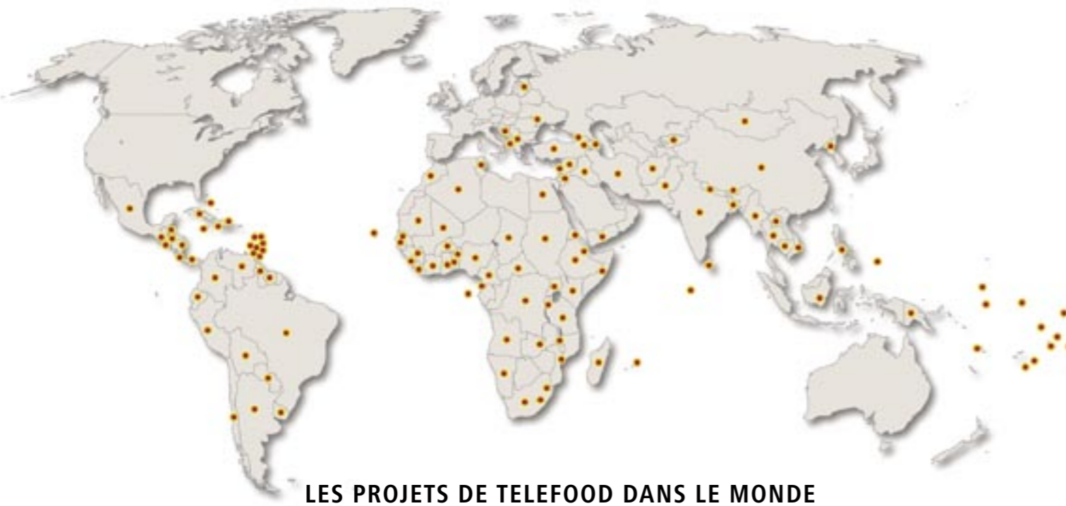
LES PROJETS DE TELEFOOD DANS LE MONDE

Pour savoir comment soutenir les activités et les événements dans votre pays ou pour devenir un partenaire de TeleFood, contactez Telefood@fao.org .